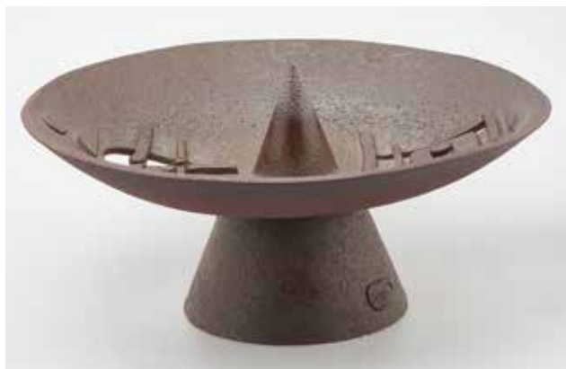
CSONKA Zsuzsa: Lelet | Zsuzsa CSONKA: Find 1994, fajansz, 25 x Ø 35 cm (Iparművészeti Múzeum, Budapest)