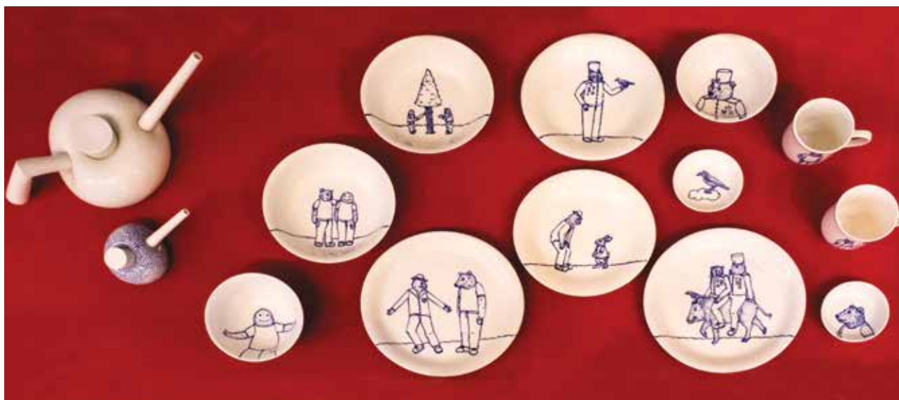
MELKOVICS Ágnes: Gyermekétkezéslet | Ágnes MELKOVICS: Dinner-set for children | 2016, porcelán, máz alatti kobaltfestés, többféle méret