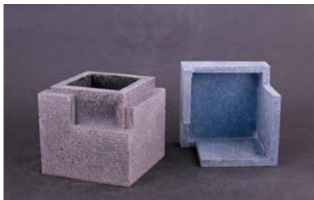
MÉSZÁROS Nóra: Betondobozok (nyitva) Nóra MÉSZÁROS: Concrete boxes (open)