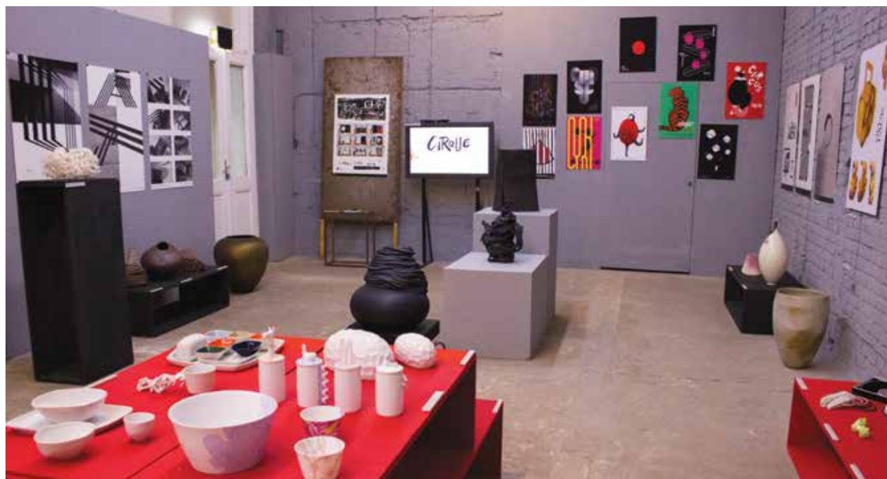
Design 2018 – Válogatás a Pécsi Tudományegyetem, Művészeti Kar, Média- és Alkalmazott Művészeti Intézet tanárainak és diákjainak munkáiból című kiállítás (részlet) 'Design 2018' – Selected works by teachers and students of the Institute of Media and Applied Arts, Faculty of Music and Visual Arts, University of Pécs (exhibition photo) FUGA Budapesti Építészeti Központ, Budapest, 2019

A megnyitó alkalmával került sor a MAMI legújabb kiadványának könyvbemutatójára. 2 A 2018 őszén megjelent Design című kötet az intézet oktatóinak és hallgatóinak díjnyertes, hazai és külföldi kiállításokon megmérettetett alkotásait, valamint diplomamunkáit mutatja be, és bár nem kiállítási katalógus, de a benne szereplő munkák jelentős része látható volt a