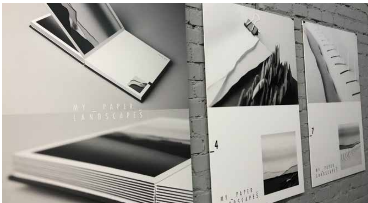
MIKLÓS Melinda: My Paper Landscapes, művészkönyv Melinda MIKLÓS: My Paper Landscapes, artist's book 2018, papír, 21x21 cm