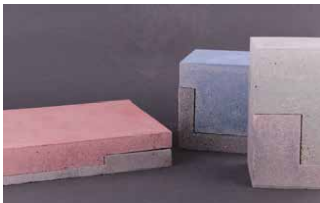
MÉSZÁROS Nóra: Betondobozok (csukva) Nóra MÉSZÁROS: Concrete boxes (closed) 2018, anyagában színezett beton, balról jobbra: 5,5x27x20 cm, 13,5x12x12 cm, 18,5x10x10 cm

Budán Miklós 2010 óta tart „betonkurzusokat” a keramikus- és szobrászhallgatóknak. Kiállított, Alapstruktúra I. című munkája autonóm kisplasztikai alkotás. Alapformája a benne rejlő alumínium alkatrész, ennek lehetséges további kibontakozását vizsgálja