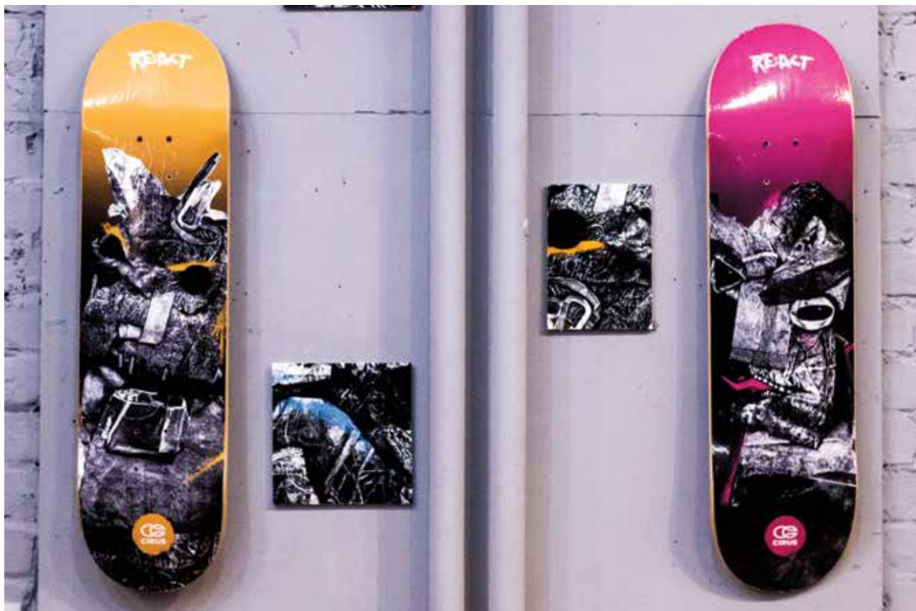
LIZOM Dávid: Cirus RE:ACT környezettudatos gördeszkaárka arculatterve Dávid LIZOM: Cirus RE:ACT – image design for the environment-friendly skateboard brand 2018, digitális print, kasírozott, a gördeszkák hosszúsága egyenként 84 cm