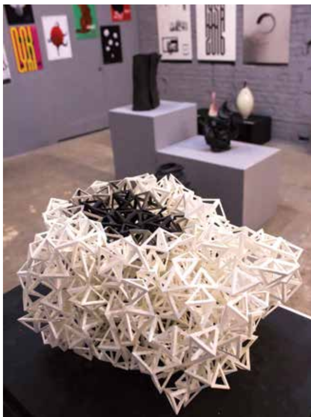
BURKUS Judit: Érzések bölcsője | Judit BURKUS: Cradle of feelings 2018, papír, 33x30x17 cm

Témavezetője, Simon Péter Bence kísérleti fotót állított ki. A számítógép képernyőjére felírt egyszerű, fehér alapon fekete szöveget egy kaleidoszkópszerű gyermekjátékhoz applikált mobiltelefonnal fotózta le. Kísérletei során, extrém nagyításban a monitor RGB képalkotó technológiájának vörös, zöld, kék színei elkülönülnek és kavargó forgatagga alakulnak a fotóin.