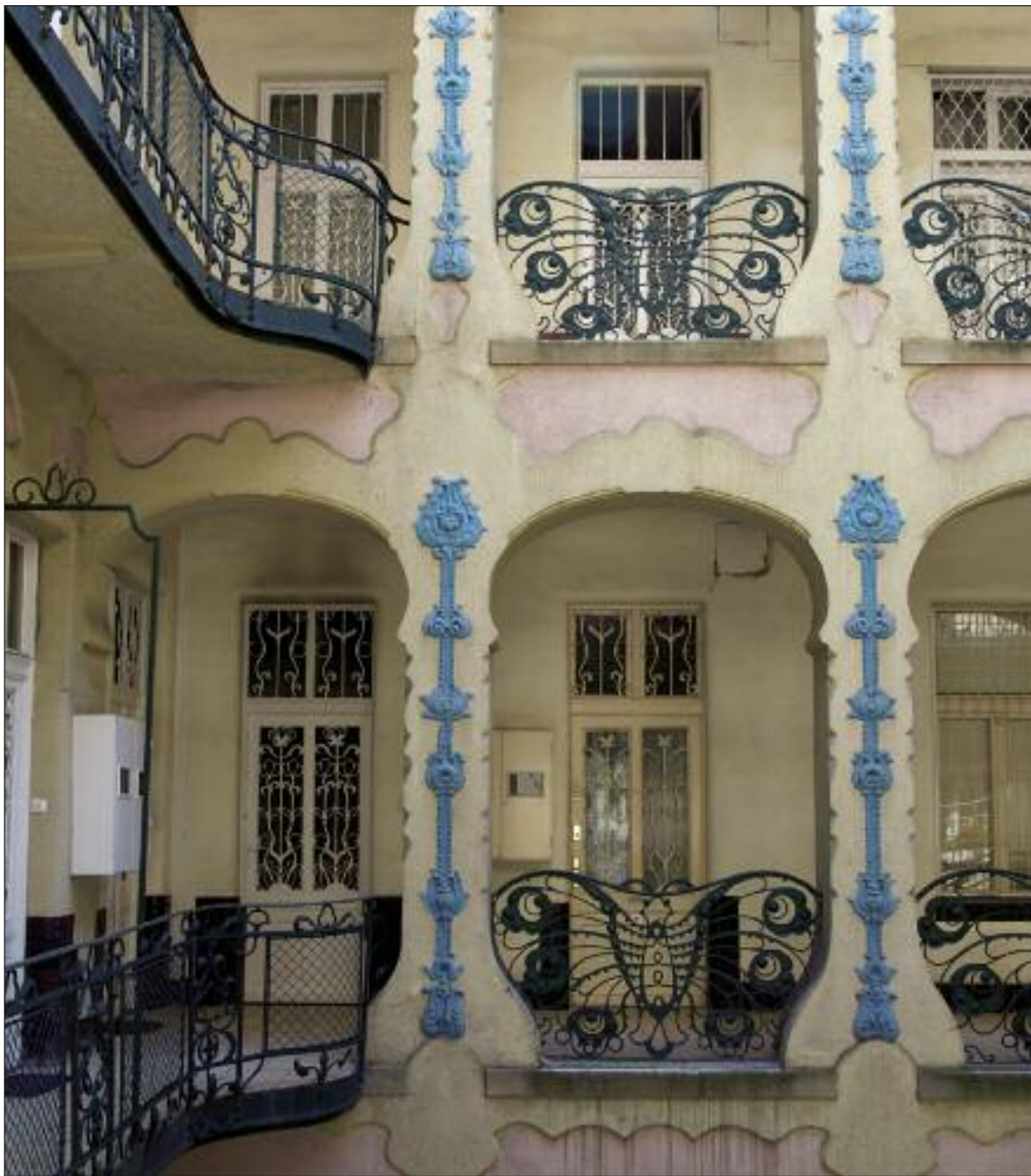
Nagy István: A Szenes-ház udvari homlokzata (részlet), Budapest / István Nagy: Court façade of the Szenes House (detail), Budapest 1905–1906