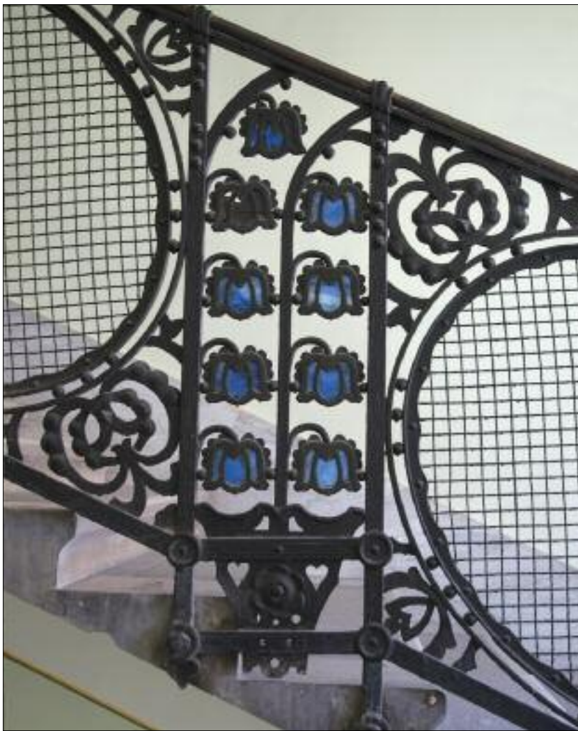
Vágó József – Vágó László: A Gutenberg-ház főlépcsőházának kovácsoltvas korlátja (részlet), Budapest / József Vágó – László Vágó: Wrought iron rail of the main staircase of the Gutenberg House (detail), Budapest 1907 (Iparművészeti Múzeum, Adattár – digitális fotógyűjtemény, Budapest)

A világnap történetében fontos momentum, hogy a brüsszeli székhelyű, a szecessziós városokat hálózatba tömörítő szervezet, a Réseau Art Nouveau Network (RANN) – amelyben az Iparművészeti Múzeum 2016 óta képviseli Budapestet – is bevette hivatalos programjai közé, és számos helyszín csatlakozott már a kezdeményezéshez, így valóban az országhatárokon túlnyúló, nemzetközi eseménnyé nőtte ki magát. Ennek összefogását segíti, hogy a RANN 2017 óta központi témát jelöl ki a világnaphoz. Ez tavaly a mozgás és mozdulat volt ( Art Nouveau & Movement ), ezért a szecessziós formákban rejülő mozgás és ritmika, illetve konkrétan a századforduló mozdulat- és táncművészete mentén jártuk körül a korszak művészetét. Az Iparművészeti Múzeum az idei, építészeti fókuszú témamegjelölés ( My favourite Art Nouveau architect ) és a múzeum épületének rekonstrukció miatti zárva-tartása okán is szecessziós városi sétákat szervezett, és szakértők, profi vezetők bevonásával a szecesszió építészeteinek változatos palettáját felvonultató programokkal készült. A városnéző séták – mind a szűken vett belvárosban, mind a külsőbb kerületekben – lehetőséget teremtenek a szecesszió építészeti formakincsének és díszítőelvének, illetve főbb törekvéseinek megismerésére.