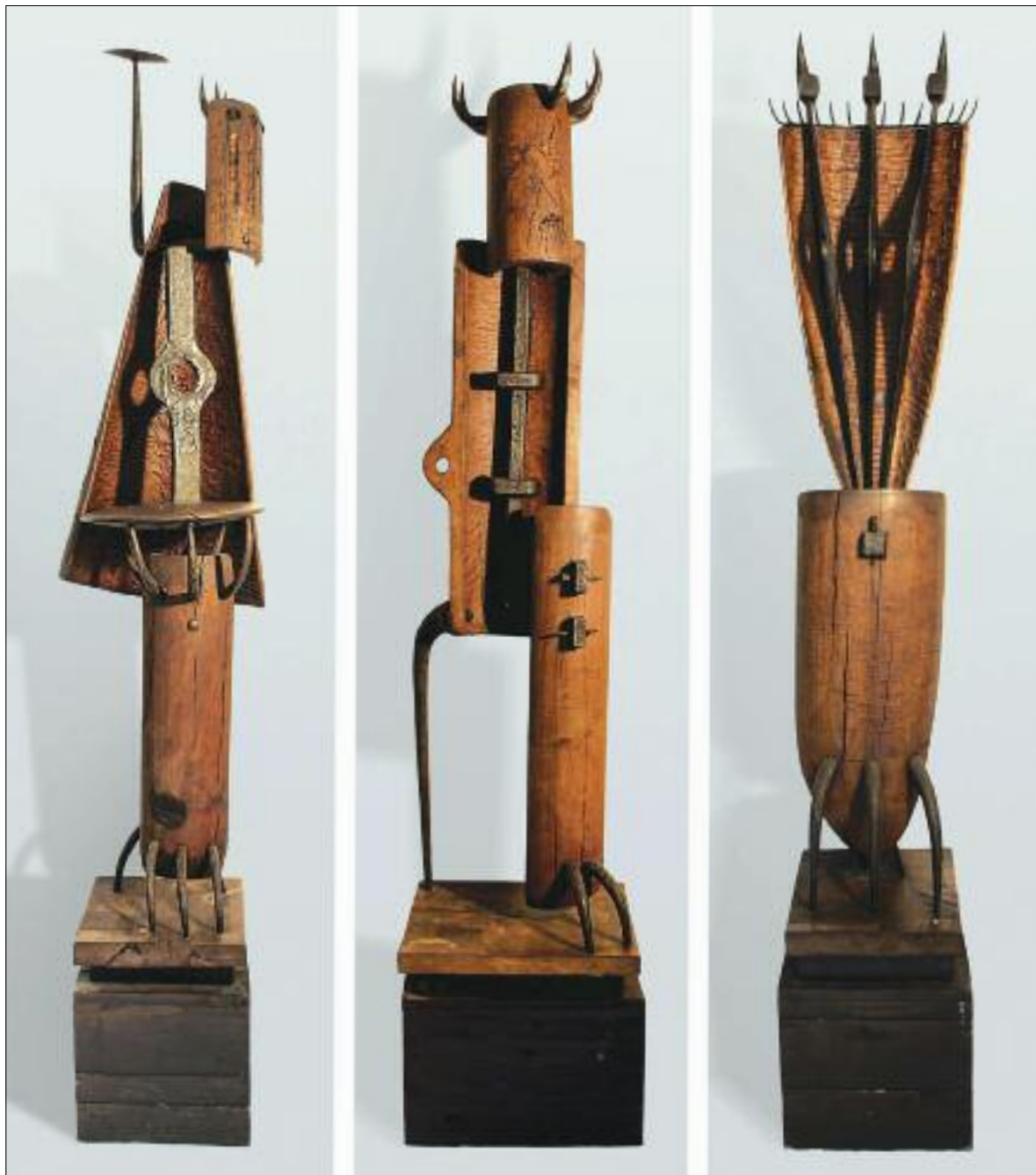
Bors István: Bálvány I-II-III. / István Bors: Idol, I-II-III 1968, kovácsoltvas, körtefa, 159x32x34 cm, 181x45x31,5 cm, 185x38x35 cm