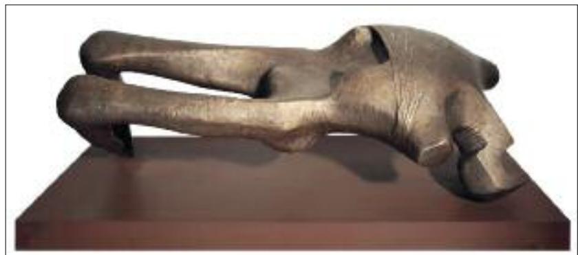
Bors István: Memento I. / István Bors: Memento, I 1963, bronz, 35x90x45 cm

Honty Márta grafikai és kárpittervei sem egyszerű-