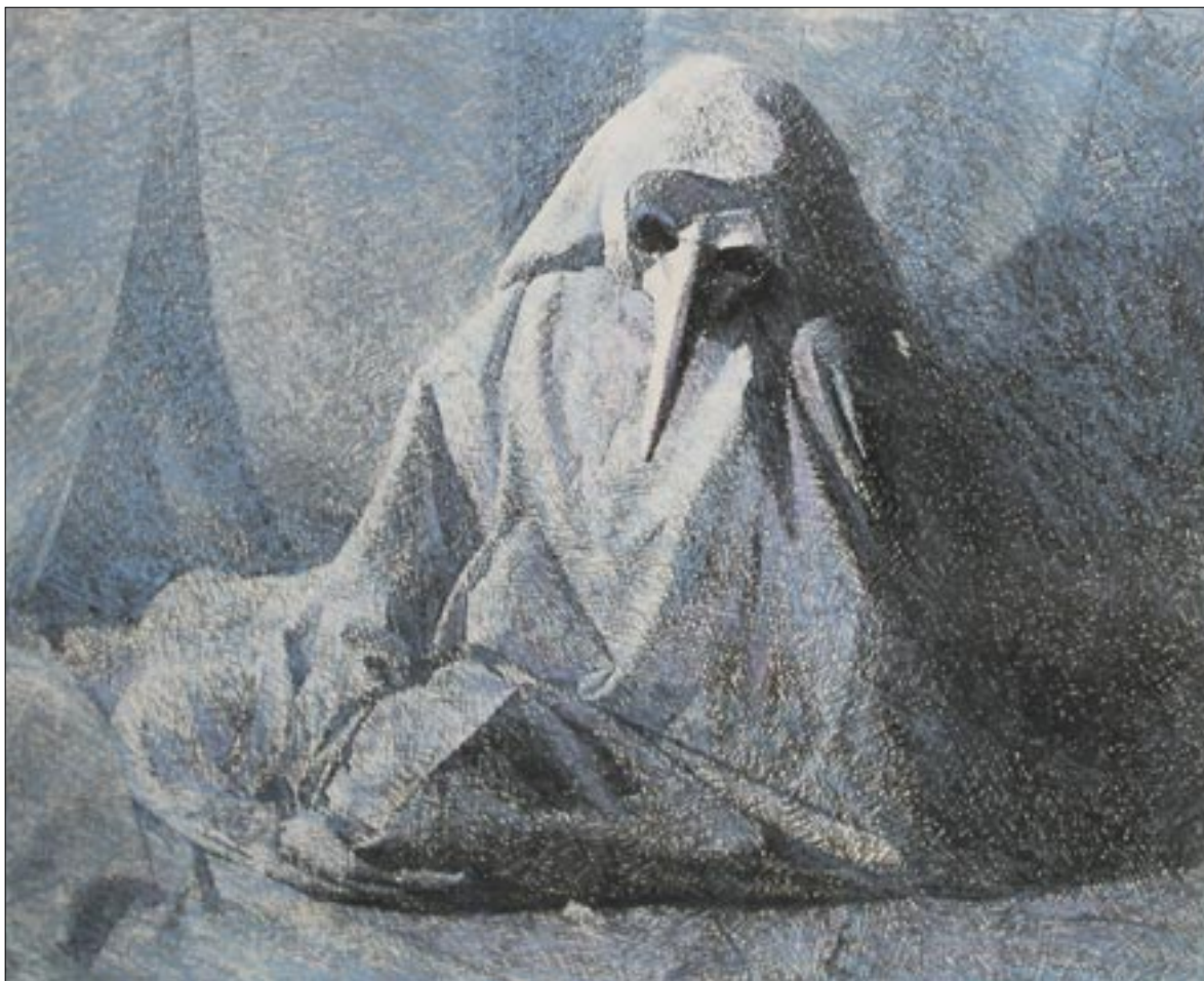
Molnár Kálmán: Nyelvemlékek sorozat – Por és hamu II. / Kálmán Molnár: Linguistic Monuments series – Dust and Ashes, II [1986] vegyes technika / miscellaneous techniques [70x100 cm]

Édes barátaim, olyan ez épen, mint az az ember ottan a mesében. Az élet egyszer csak órája gondolt,