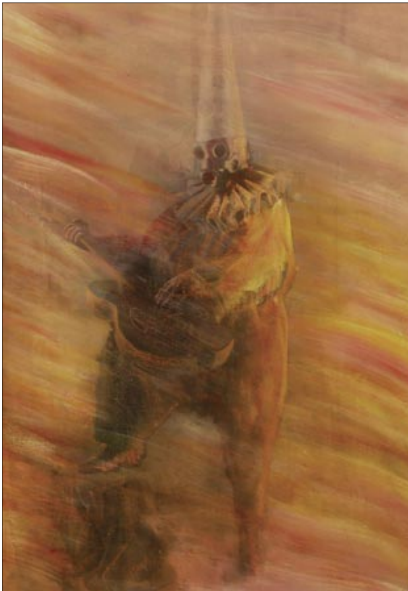
Molnár Kálmán: Végjáték rózsaszín fényben I. / Kálmán Molnár: Endgame in Pink Light, I [1990] vegyes technika / miscellaneous techniques [100x70 cm]

mi meg mesélni kezdtünk róla: „Hol volt...”, majd rázabant a mázsás, szörnyű mennybolt s mi ezt meséljük róla sírva: „Nem volt...” Úgy fekszik ő, ki küzdve tört a jobbra, mint önmagának dermedt-néma szobra. Nem kelti föl se könny, se szó, se vegyszer. Hol volt, hol nem volt a világon, egyszer.