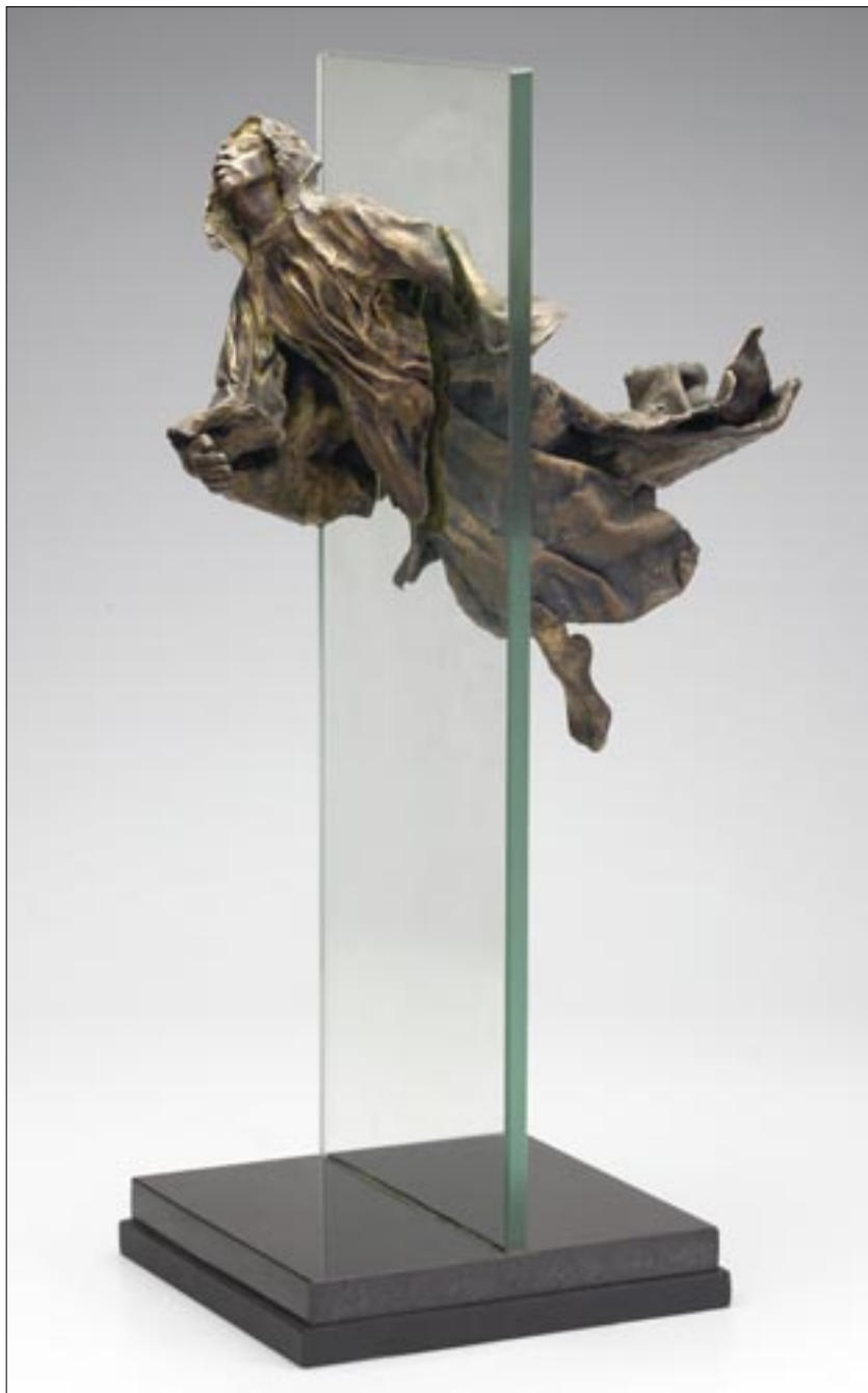
Molnár Éva: Angyali üdvözet, plasztika / Éva Molnár: The Annunciation. Sculptural work

Gombos István katalógusban szereplő, nagyon szép,