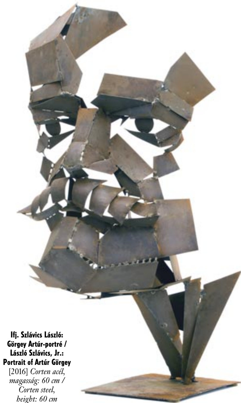
Ifj. Szlávic László: Görgey Artúr-portré / László Szlávic, Jr.: Portrait of Artúr Görgey [2016] Corten acél, magasság: 60 cm / Corten steel, height: 60 cm

de szertelen fantáziával alkalmazza azokat. A Hedonista kehely című kókuszdió serlegének sokfigurás talpa, az Életkehely kókusz-cuppájának peremén kifelé másszó kis figurája, valamint a nyakékei, amelyek egyikén