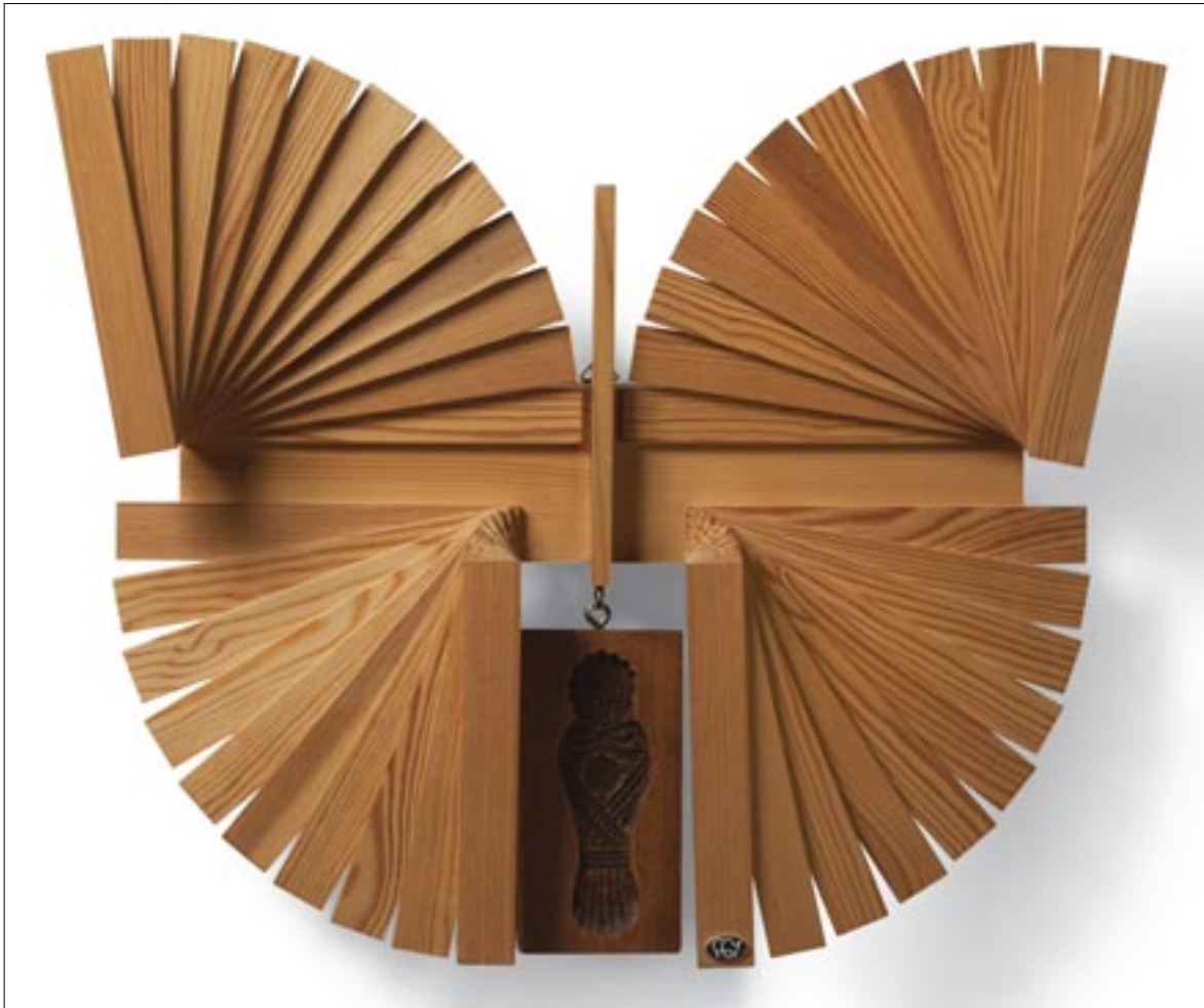
Fekete György: A lepke két élete / György Fekete: Two Lives of Butterflies [1979] mézeskalács- nyomóforma, fakonstrukció / gingerbread mould, wood construction [48x48x10 cm]

1956-ban fegyveres csoportot szervezett, hogy megakadályozzon mindennemű erőszakos cselekedetet a környéken. Azt mondta, a bűnösöknek majd törvényes bíróság előtt kell felelniük. Helyzetünk a főiskolán persze kérdéses volt, Redő Ferencnek – aki esztétikát tanított, és ő volt a párttitkár is – köszönhattük, hogy maradhattunk.