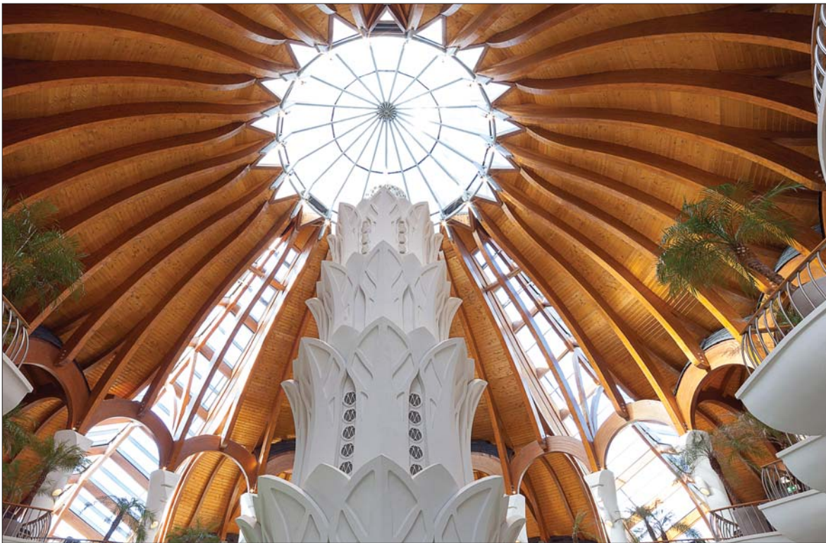
Makovecz Imre: Hagymatikum fürdő, Makó (belső kép). Belsőépítész: Mezei Gábor / Imre Makovecz: Hagymatikum Thermal Bath, Makó (interior). Interior designer: Gábor Mezei [2007–2012]

emlékeket, nem csupán halott anyagokat és a fizikai megvalósítás technikai önéletrajzát. Óriási grafikai életművet is létrehozott, hogy a tanító szó erejét a meggyőző látvány többletével is megnövelje. Létrehozta a szerves építészet szentélyét a Kós Károly Egyesülés szervezetében, és vándoriskolát létesített az új nemzedék számára, ami a hazai építészet szellemi tudati skálájának új mintájaként európai jelentőségűvé tette, s vele a folyamatosságot is biztosította. Egy utánzásra nem kényszerített nemzedék így vált utódlásra alkalmassá. Szinte evvel egy időben szervezte meg az egyesületként működő Magyar Művészeti Akadémiát – mint a hazai kulturális stratégia érvényre juttatásának egyik, talán legfontosabb bázisát.