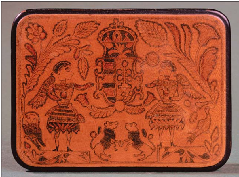
Hodó József: Tükrös, barokk országcímerrel / József Hodó: Mirror with the Baroque coat of arms of Hungary Drávaiványi, 19. század második fele (Néprajzi Múzeum, Budapest) / Drávaiványi, second half of 19th century (Museum of Ethnography, Budapest)

legénykötényekről, de más művelődéstörténeti adatokban is csemegézhetünk, így például a huszárok szivarozási divatjával, vagy a betyárokat övező hőstörténetekkel kapcsolatban. Népi alkotások, iparosok mestermunkái és egyedi művészi megnyilvánulások mutatják be, hogy a szabadságharc leverése után, a 19. század végén a népi kultúra felfedezésének hatására hogyan bontakozott ki egy újabb paraszti díszítőstílus, melynek szerves részévé vált a nemzeti identitás kifejezése díszítőművek és motívumok eszközkészletével. A korszakban a népművészeti tárgyak gyűjtését hazafisággal indokolták, a polgári társadalom igényelte a nemzeti termékeket. A legkülönbébb tárgyra: a cifraszűrre, a férficsizmára, a női atlaszicipőre, a dísztörülközőre, a kosztözcacsóra, a széktamlára is rákerült az országcímer, a magyar korona és a hazafias feliratok.