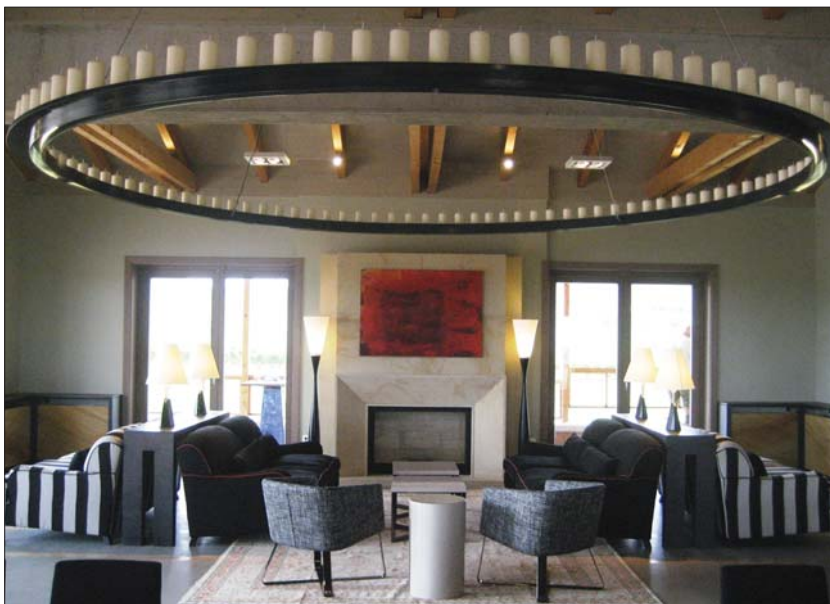
Somlai Tibor: Sauska borászat fogadótere, Villány / Tibor Somlai: Reception space. Sauska Winery, Villány [2009]