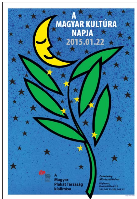
Baráth Ferenc: A Magyar Kultúra Napja 2015 / Ferenc Baráth: Day of Hungarian Culture, 2015 [2015] digitális print / digital print [100x70 cm]

150 évvel ezelőtt adta a világnak az első színes plakátot. Ennyire új műfajról beszélünk. A plakát megteremtői között kezdetben csak festőket találunk, Toulouse-Lautrec a tagadhatatlan doyenje a műfajnak, de az első magyar színes plakát készítői között is festők szerepelnek: Benczúr Gyula, Rippl-Rónai József, Ferenczy Károly, Berény Róbert, Bortnyik Sándor vagy Kassák Lajos, hogy aztán színre léphessen egy