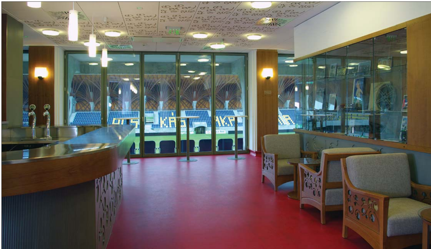
Kilátás a VIP-társalgó bárjából, Pancho Aréna, Felcsút. Építész: Dobrosi Tamás. Belsőépítész: Snopper Zsuzsa. Kivitelezők: Merényi Zoltán (fém-munkák), Czibók Péter (üvegmunkák), Szabó Attila (asztalosmunkák) / View from the bar of the VIP lounge. Pancho Arena, Felcsút (detail). Architect: Tamás Dobrosi. Interior design: Zsuzsa Snopper. Manufacturers: Zoltán Merényi (metal works), Péter Czibók (glass works), Attila Szabó (joiner works) [2013–2014]

folyományaként a Puskás Akadémia kollégiumi épületében, az aulában, a refektóriumban és a kápolnában végzett komplex belsőépítészeti tervezést.