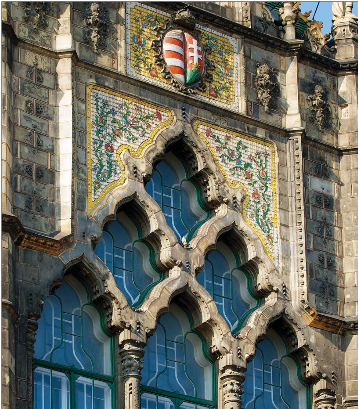
Az Iparművészeti Múzeum mázas kerámiával díszített homlokzata (részlet), Budapest. Terv: Lechner Ödön, Pártos Gyula; kivitelezés: Zsolnay-gyár, Pécs / Façade of the Museum of Applied Arts, Budapest, ornamented with glazed ceramics (detail). Designed by Ödön Lechner, Gyula Pártos; manufacturer: Zsolnay Porcelain Manufacture, Pécs [1893–1896]