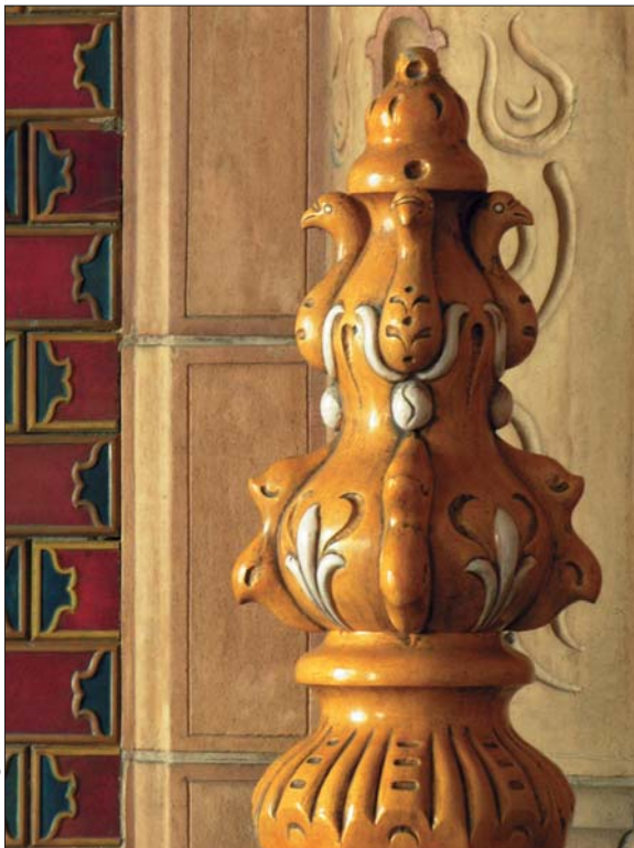
Az Iparművészeti Múzeum mázas kerámia bejárati korlátja (részlet), Budapest. Terv: Lechner Ödön, Pártos Gyula; kivitelezés: Zsolnay-gyár, Pécs / Glazed ceramics entrance balustrade of the Museum of Applied Arts, Budapest (detail). Designed by Ödön Lechner, Gyula Pártos; manufacturer: Zsolnay Porcelain Manufacture, Pécs [1893–1896]

táson hangsúlyos módon jelennek meg az életmű főbb vonulatai, mint az ornamentika, az orientalizálás, a tervezés folyamatának egyes állomásai, az épület, a dekoráció és a berendezés kapcsolata. Minthogy Lechner elképzeléseinek megvalósításához a Zsolnay kerámiában találta meg a legmegfelelőbb anyagot, és mellesleg Zsolnay Vilmosban a kitűnő művészi partnert is, ezen aspektusok szintén kellő hangsúlyt kapnak. Ennek bemutatására nagyszámú Zsolnay épületkerámia-elem szerepel a kiállításon. Ugyancsak ér-