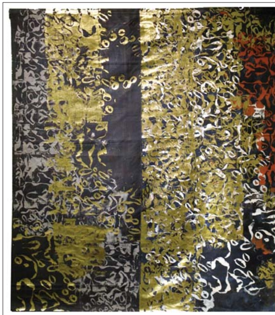
Szalontai Éva: Aranyló textúrák / Éva Szalontai: Golden Textures [2007] laufer-vászon, fóliával nyomott / 'laufer' linen, foil printed [120x100 cm]

rokból álló képei az ikat-technikára, finom színei a melírozott fonalakra emlékeztetnek. Kezei alatt a régi, már hulladéknak minősülő színes újságok képeinek árnyalatai festőien érvényesülnek. A részletek aprólékos megfigyelése és a kép egészében való értelmezése újabb felfedezésekhez vezet.