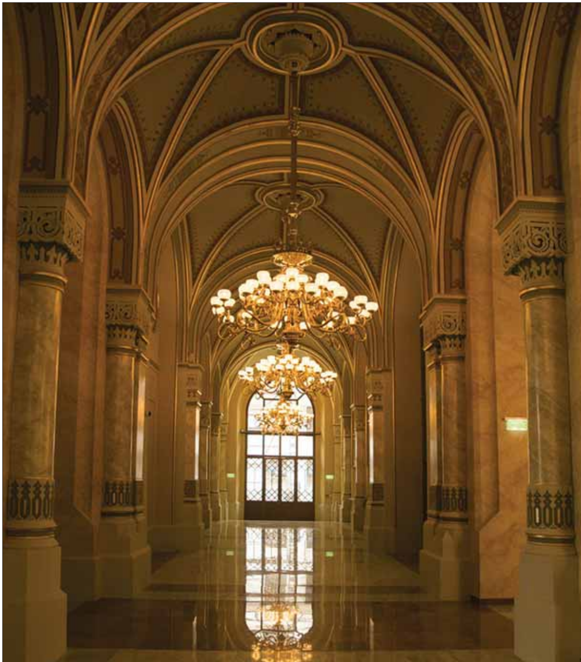
A rekonstruált kocsiáthajtó, Vigadó, Budapest / The reconstructed driveway. Vigadó, Budapest