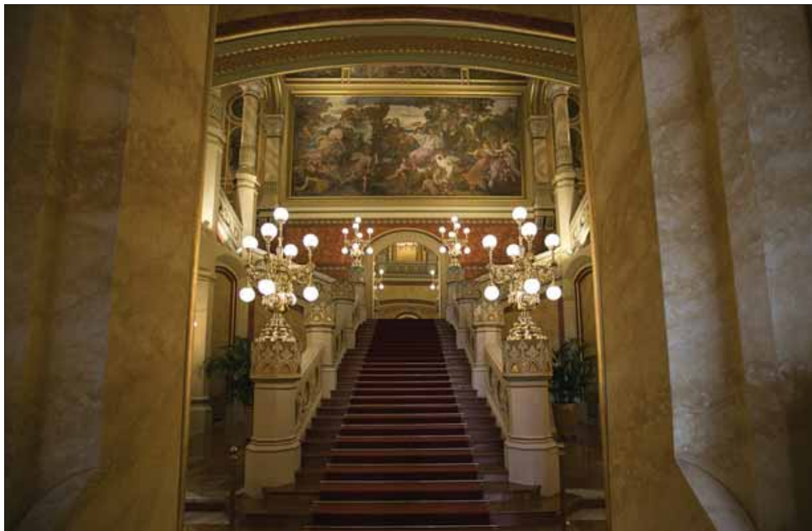
Főlépcsőház, a háttérben Than Mór falképe, Vigadó, Budapest / The main stair hall with Mór Than's mural in the background. Vigadó, Budapest