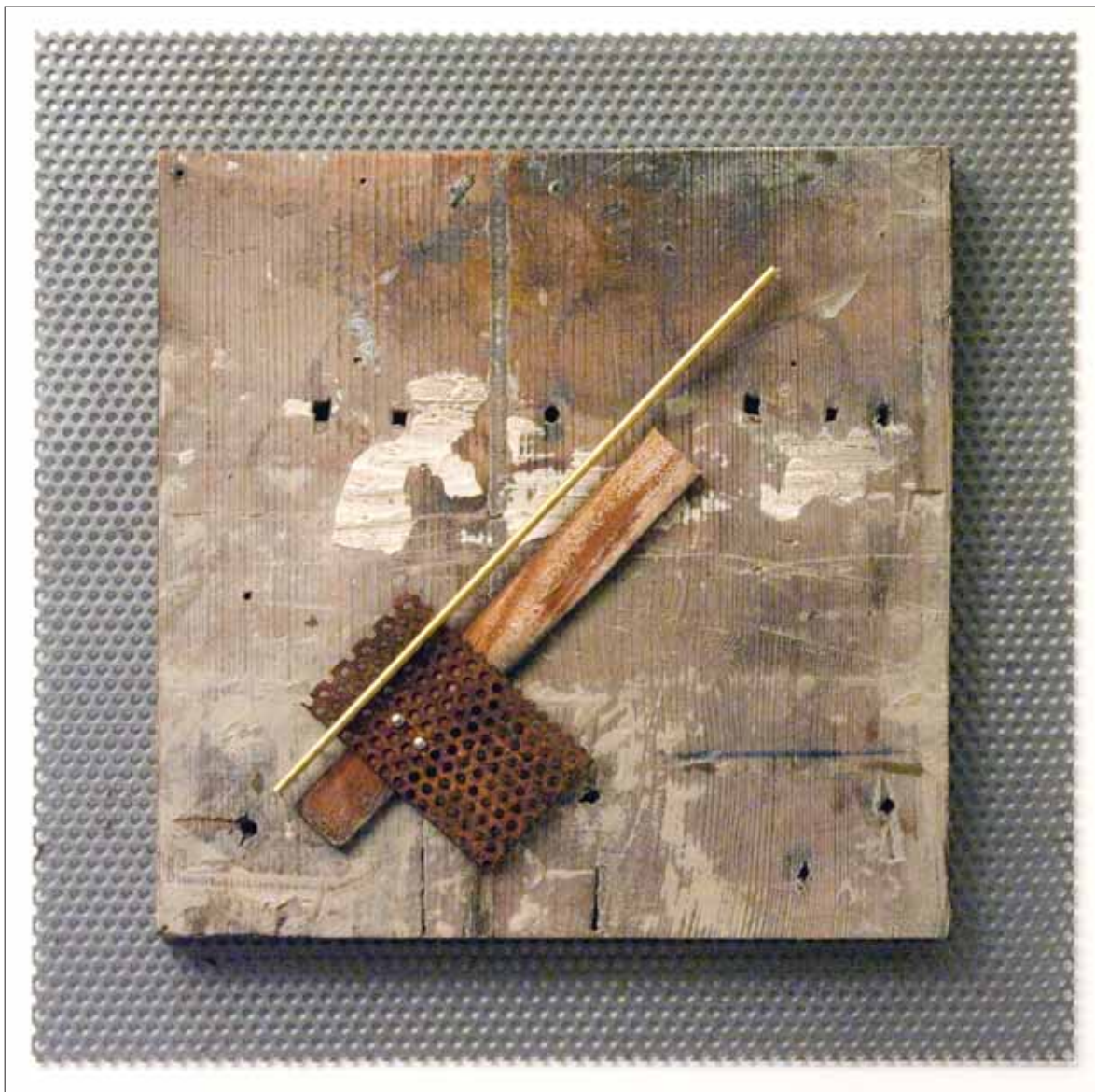
Ifj. Szlávics László: Dombormű XXIII. / László Szlávics, Jr.: Relief, XXIII [2011] fá, vas, sárgaréz, vegyes technika / wood, iron, brass, miscellaneous techniques [30x30 cm]

Nem nélkülözték a mozgás-mozgatótatás lehetőségét azok az éremdobozai sem, amelyekben homok volt az alap, a háttér. Ha hozzáért az ember egy ilyen tárgyhoz, lényegét illetően nem, ámde látványában változott a jelenség, ami persze értelemszerűen csak