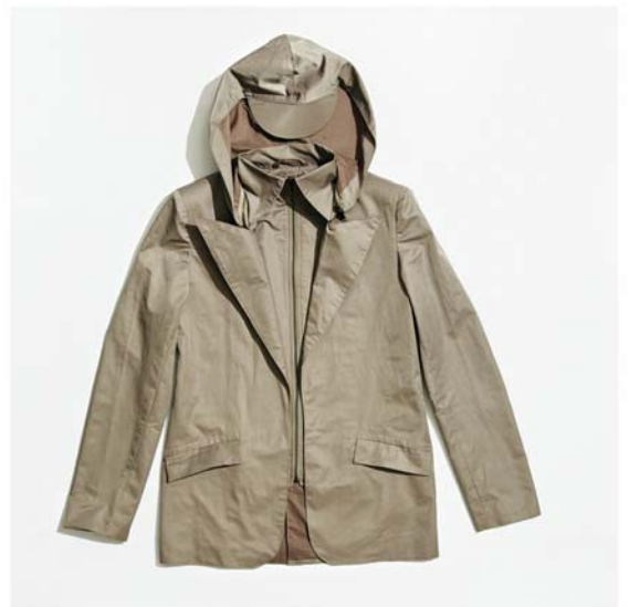
Földi Petra: 2012/13 esőkabát-kollekció / Petra Földi: 2012/13 Raincoat collection