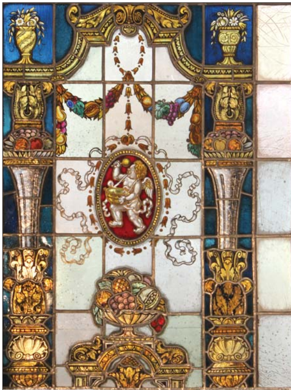
Szólistaöltöző ólmozott üvege restaurálás után (részlet), Zeneakadémia, Budapest / Stained-glass window of a soloists' dressing room, after restoration (detail). Music Academy, Budapest

kőkút keretét alkotó mozaik falakra és frízekre. A promenoir jobb- és baloldali részében van a szokatlanul nagyméretű rubatár, melynek a folyosóra kapcsolt mindkét báltárvonalán színes üvegmezőkre tagolt ajtók tompítják az arányok nagyságát. A promenoir központjából s a körbe futó folyosókról összesen nyolc kényelmes bejáró vezet abba a terembe, melyre szinte vértanúi türelemmel évtizedeken át vártak a zene iránt érdeklődők. Ez a nagy hangversenyterem. Díszítése pazar, terjedelme nem az iskolák szokásos méreteihez van szabva. Két emelet magasságban a különböző stílusok szerencsésen modernizált elegyedésében gyönyörködik a belépő. A terem hatalmas nézőterével szemben a palermói Capella Palatina egyszerű és nemesen idea-