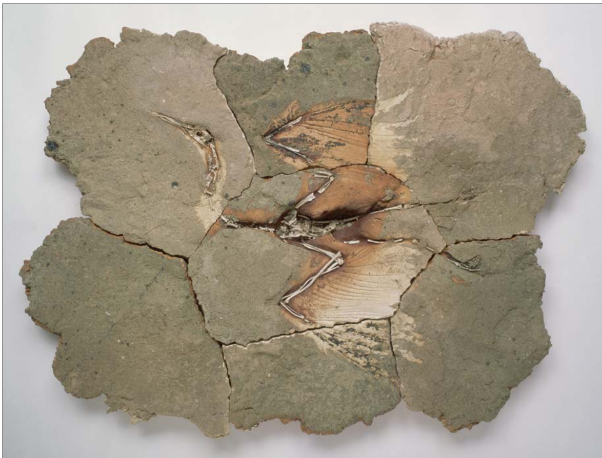
Schrammel Imre: Szőrke gém / Imre Schrammel: Heron [1984] samott, 1140 °C (Janus Pannonius Múzeum, Pécs) / fireclay, 1140°C (Janus Pannonius Museum, Pécs) [120x170 cm]

Legutóbb, a kecskeméti Kápolna Galériában láthattuk a Minótauros -szorozat nyomán folytatott legújabb alkotásait. Műhelyében most is továbbviszi újító kísérleteit. „ Apostola, mániákusa, mestere és tudója a szakmájának. A kerámia és a porcelán művészetének ” – írta róla Kernács Gabriella a monográfiában.