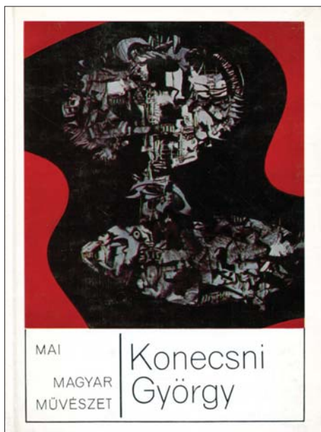
MAI MAGYAR MŰVÉSZET | Konecsni György