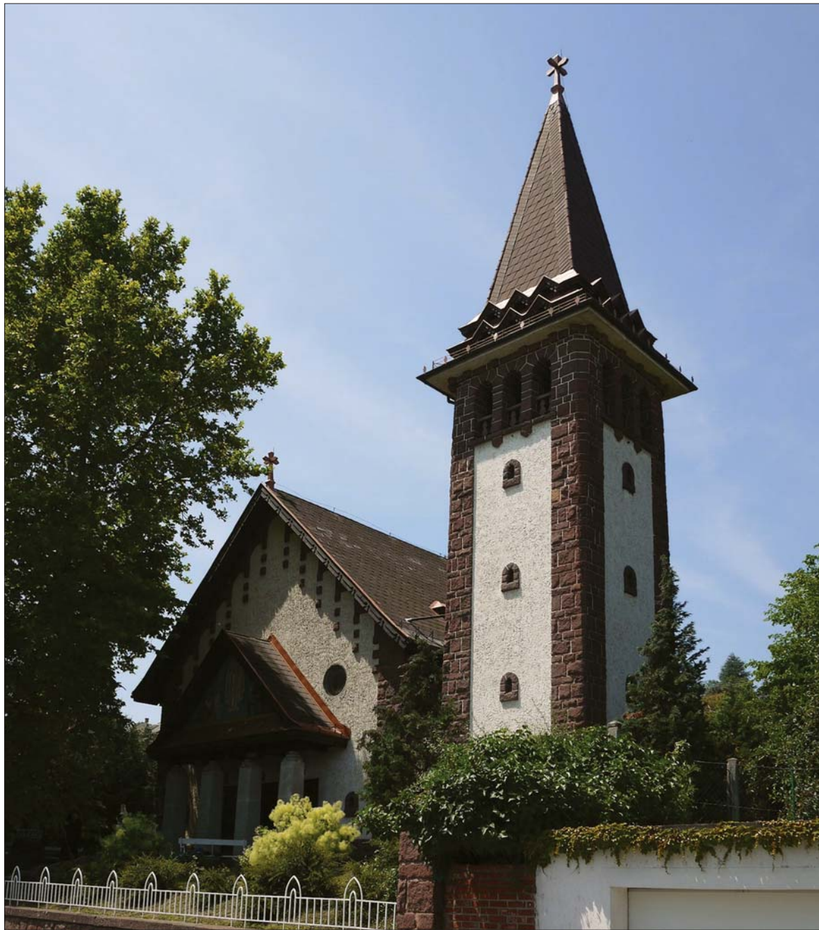
A Szent Imre-templom főhomlokzata, Balatonalmádi / Main front of the St. Emmerich Church, Balatonalmádi