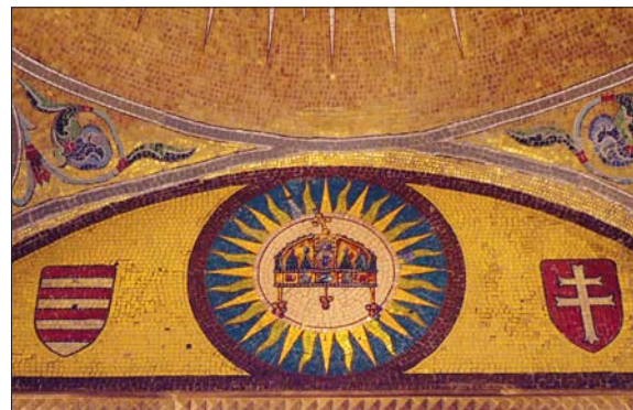
Szent Korona-ábrázolás a bejárat feletti mozaikon, Szent Jobb kápolna, Balatonalmádi / The Holy Crown of Hungary rendered on the mosaic above the entrance. The Chapel of the Holy Right Hand of King St. Stephen, Balatonalmádi

zettől függetlenül, a Habsburg-hatalommal szembeni ellenállás kifejezésére adott lehetőséget.