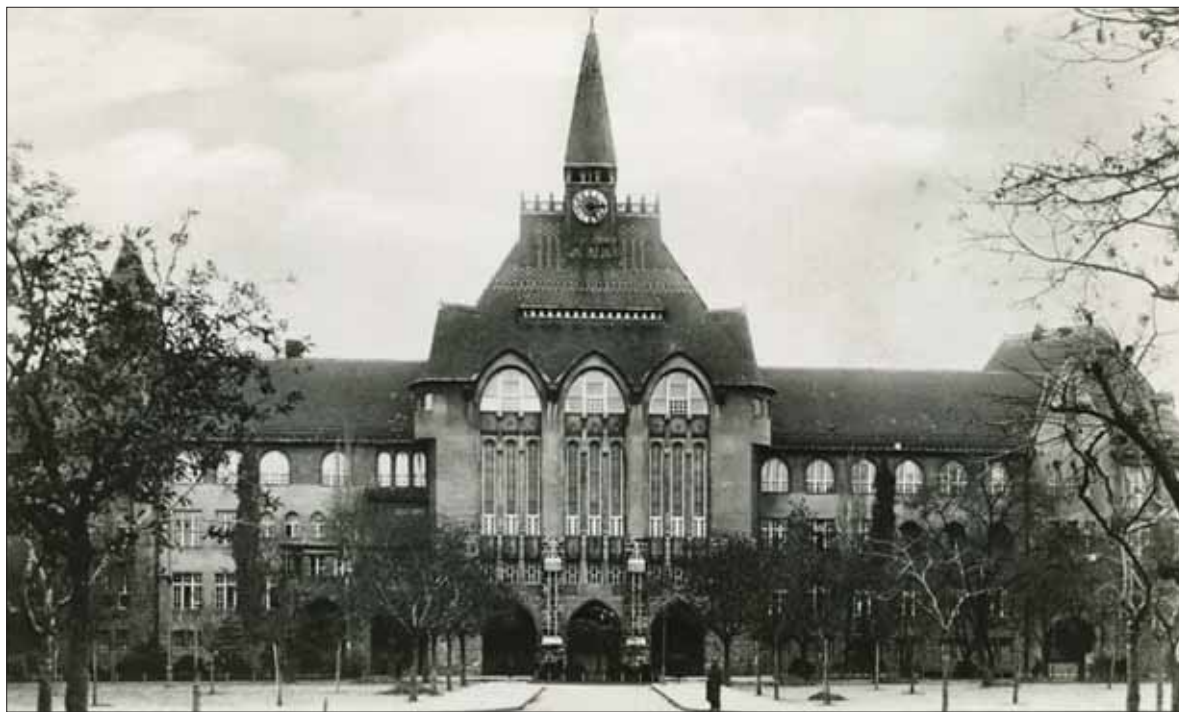
A kecskeméti református Újkollégium képes levelezőlapon, 1935 / The building of the Calvinist New College in Kecskemét in a picture postcard, 1935