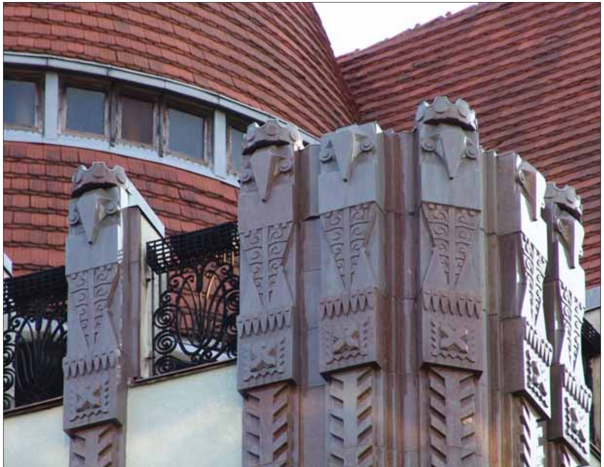
Kerámibaglyok a sarokterazon, Újkollégium, Kecskemét / Ceramic owls on the corner balcony. New College, Kecskemét [1911–1912] Zsolnay pirogránit / Zsolnay pirogranite

duló éveiben a gyülekezet a hiányzó címereket újrakészíttette a Zsolnay-gyárban, és azokat helyeztette vissza. Ezek a pótlások jól elkülönülnek az eredeti elemektől sötétebb színük miatt. A címerek fölötti ablakok között oldalt lépcsőzetesen visszaugratott pilaszterek húzódnak az erkélyfalakig, melyek fölé emelkedve baglyok sorakoznak. A többi ablak fölött is húzódik egy-egy kerámiafejezet, fűrészfogas, hullámvonalas, csillag- vagy virágmotívummal díszítve. Az árkádok alatti főbejárati kaput is pirogránit keret foglalja magában, melyen a fentebb leírt kovácsoltvas motívumok tükröződnek, stilizált csillag- vagy virágszerű elemekkel kiegészülve. Az árkádok alatti csúcs-