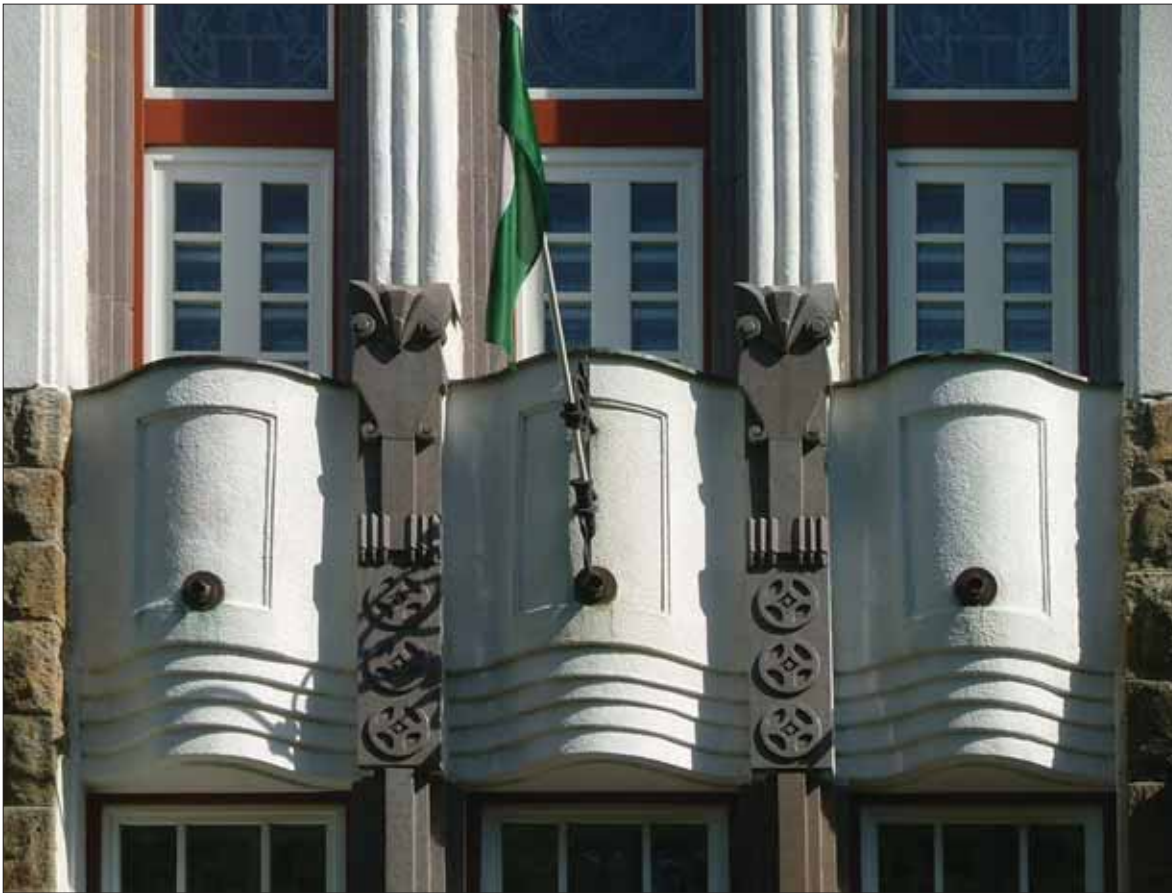
Kerámiabaglyok a díszterem erkélykorlátján, Újkollégium, Kecskemét / Ceramic owls on the bars of the balcony of the festive hall. New College, Kecskemét [1911–1912] Zsolnay pirogránit / Zsolnay pirogranite

Az épületen belül a lépcsőkorlátok képviselik a kovácsoltvas-mesterséget. A főlépcsőház korlátait kanyargó indákra fölfűződő, húsos szirmú és levelű virágok díszítik. A Cifrapalota felőli, oldalsó lépcsőház korlátjai egyszerűbb kiképzésűek, halszállkamotívumot alkotó pálcák és golyódíszek ritmikus váltakozásából épülnek fel. A Kálvin téri sarokbejárat lépcsőházában hálószerűen kiképzett, rombuszmintába rendeződő levélmotívumok alkotják a korlátot.