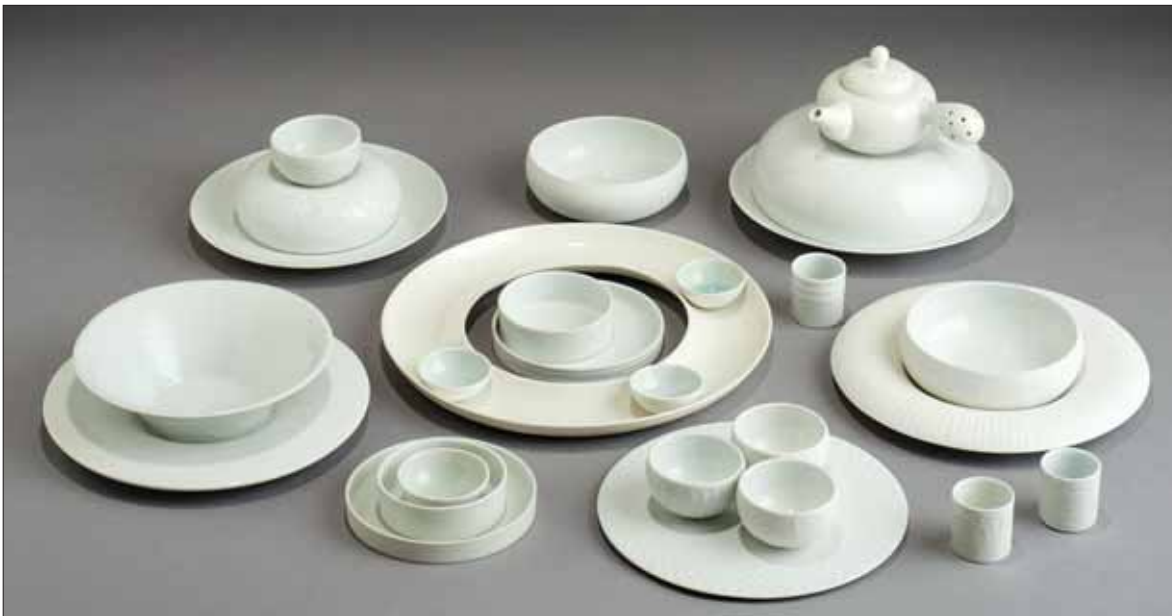
Kondor Edit: Porcelán asztali tárggygyűttes / Edit Kondor: Porcelain table set [2012] porcelán / porcelain

(Megvalósult művek 2012. A Nemzeti Kulturális Alap által támogatott iparművészek kiállítása. Iparművészeti Múzeum, Budapest, 2013. január 25–március 10.)