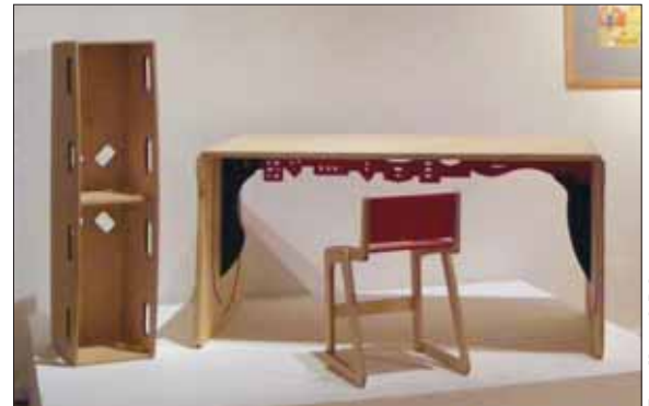
Fotó: Horváth Róbert

Püspök Balázs: Óvodai bútorcsalád / Balázs Püspök: Kindergarten furniture family [2012] fa, rétegzelt lemez, kiállítási fotó: Iparművészeti Múzeum, Budapest, 2013 / wood, plywood, exhibition photo: Museum of Applied Arts, Budapest, 2013