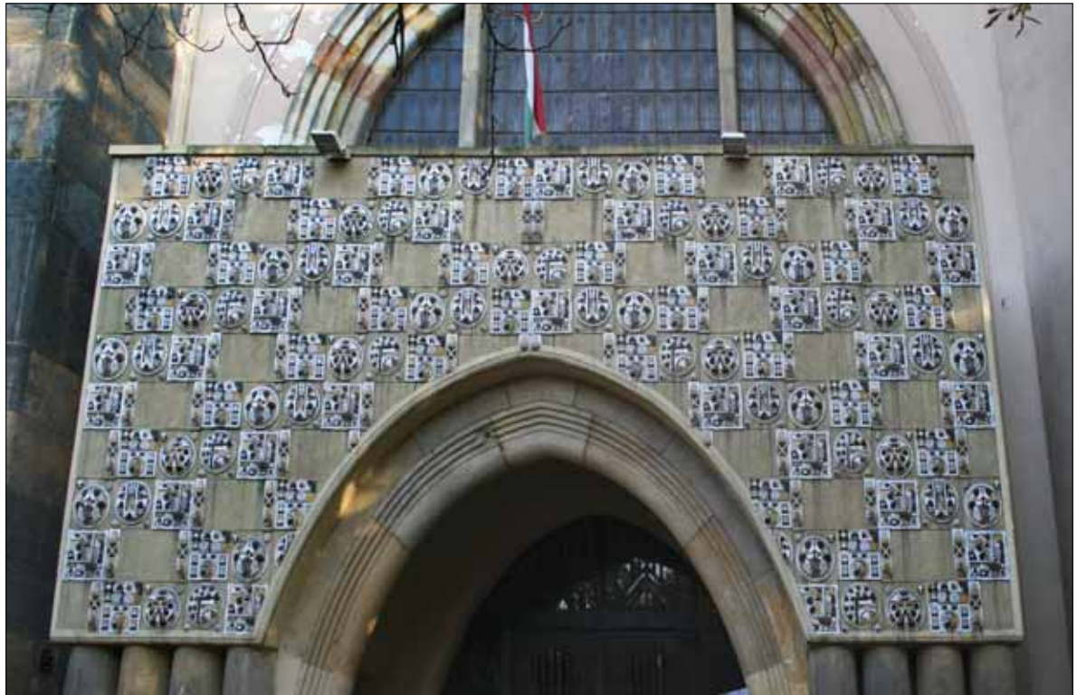
Városligeti fasori református templom, főhomlokzat (részlet), Budapest. Zsolnay kerámiával burkolva. Építész: Árkay Aladár / Main front (detail). Calvinist Church, Városliget Avenue, Budapest. Covered with Zsolnay ceramics. Architect: Aladár Árkay [1913]

Az egyházközség megalapítására 1903-ban került sor, Erzsébet–Terézvárosi Parochiális Kör néven. A gyülekezetet szervező Kovács Emil, mint a terület lelki gondozásával megbízott, a Kálvin téri (akkori írásmóddal Calvin téri) egyházközség lelkipásztora, 1901-től látta el feladatát. A templomépítés céljára 1903-ban gyűjtés indult. Laky Adolf ) ékszerész 1908-