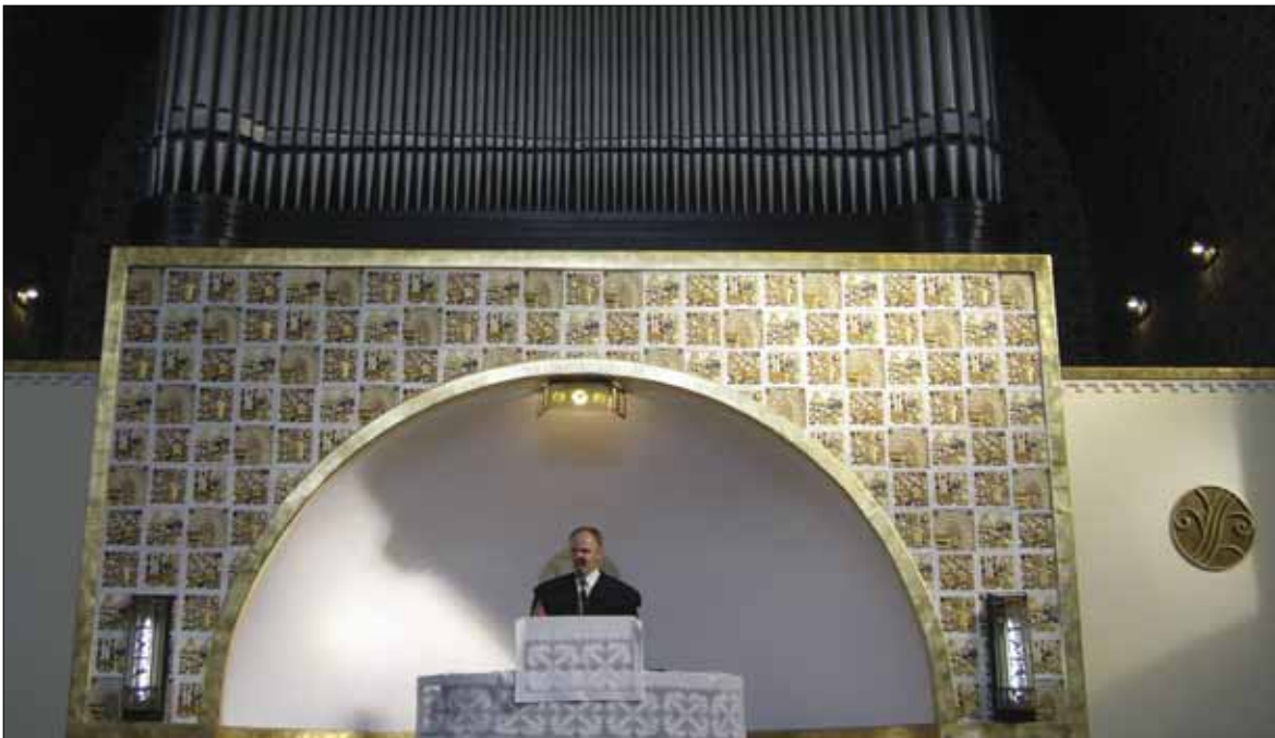
Városligeti fasori református templom, Budapest (belső kép). Orgonakarzat az Angster orgonával, alatta a szószékkel / Interior. Organ-loft with the Angster organ and pulpit. Calvinist Church, Városliget Avenue, Budapest [1913]