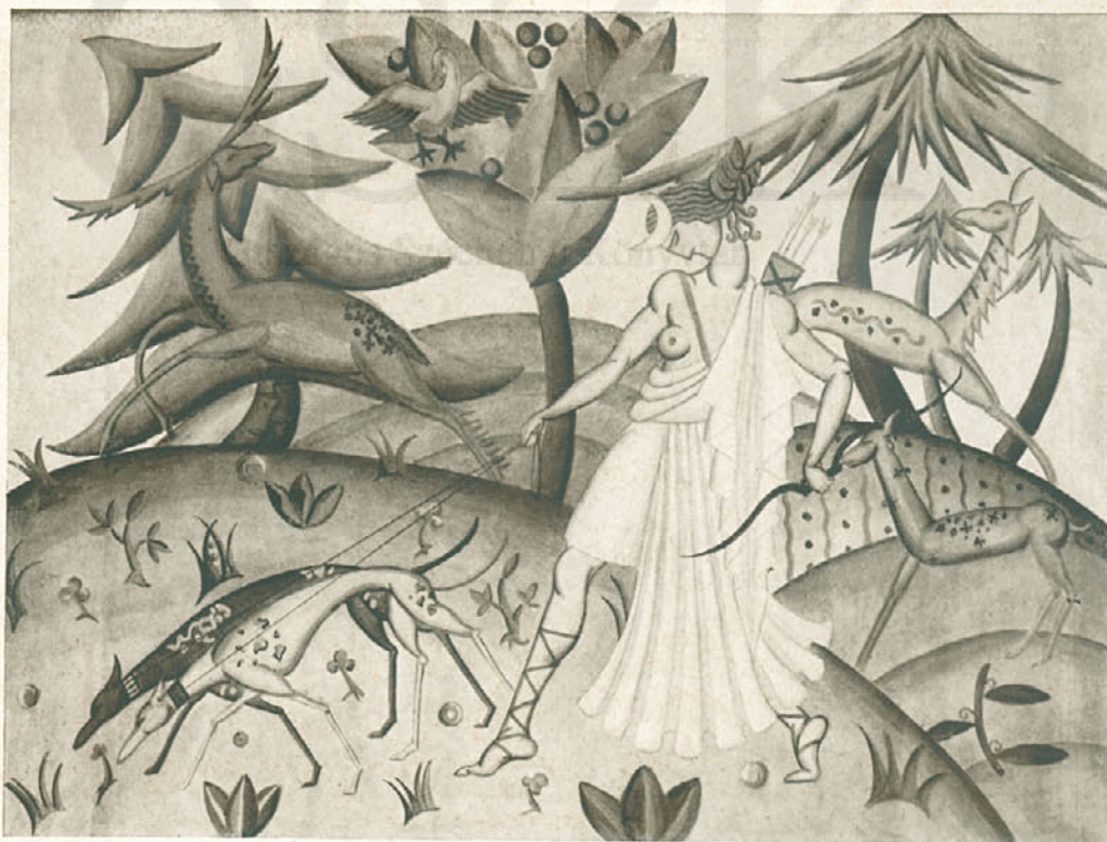
Szemelvények a m. kir. Iparművészeti Iskola textilosztályának évvégi kiállításából. Szövetfestéshez készült tervek. Tanár Muhits Sándor. — Schülerarbeiten der Textilklasse der Königl. Kunstgewerbeschule, Budapest. Entwürfe für Stoffmalerei. — Maquettes pour des étoffes teintes. École royale des Arts décoratifs, Budapest.