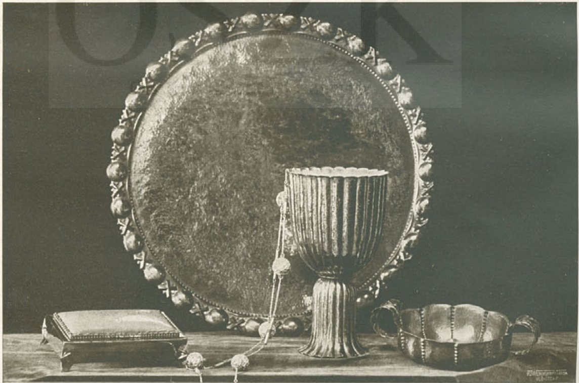
Szemelvények a m. kir. Iparművészeti Iskola ötvös-ékszerész szakosztályának évvégi kiállításából. Tanár Csajka István. — Schülerarbeiten der Fachklasse für Edelmetallarbeit der Königl. Kunstgewerbeschule, Budapest. — Ouvrages de la classe d'orfèvrerie. École royale des Arts décoratifs, Budapest.