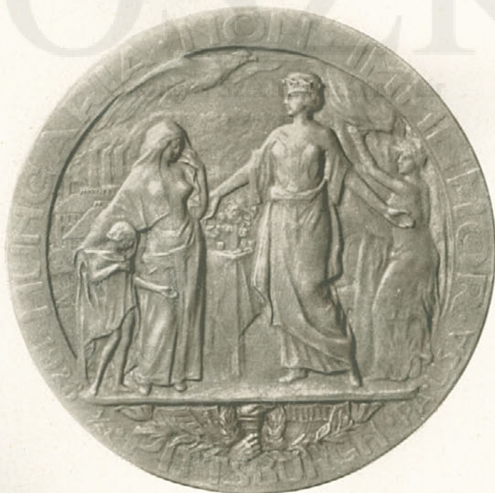
Finta Sándor (Newyork): Relief-illustráció Wall Whitman »A kínések honába vezető nehéz út« című költeményéhez. A magyarok pittsburghi látogatásának emlékérmé. — Reliefillustration zu Wall Whitmans Gedicht »Passage to India«. Erinnerungsmedaille des Besuches der Ungarn in Pittsburgh. — Plaque et médaille commémorative par A. Finta (Newyork).