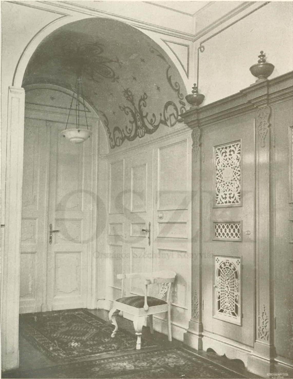
Gróf József: Hall részlete beépített szekrénnyel. Készült Faragó és Gróf műhelyében. — Teil einer Diele mit eingebautem Schrank. — Vestibule.