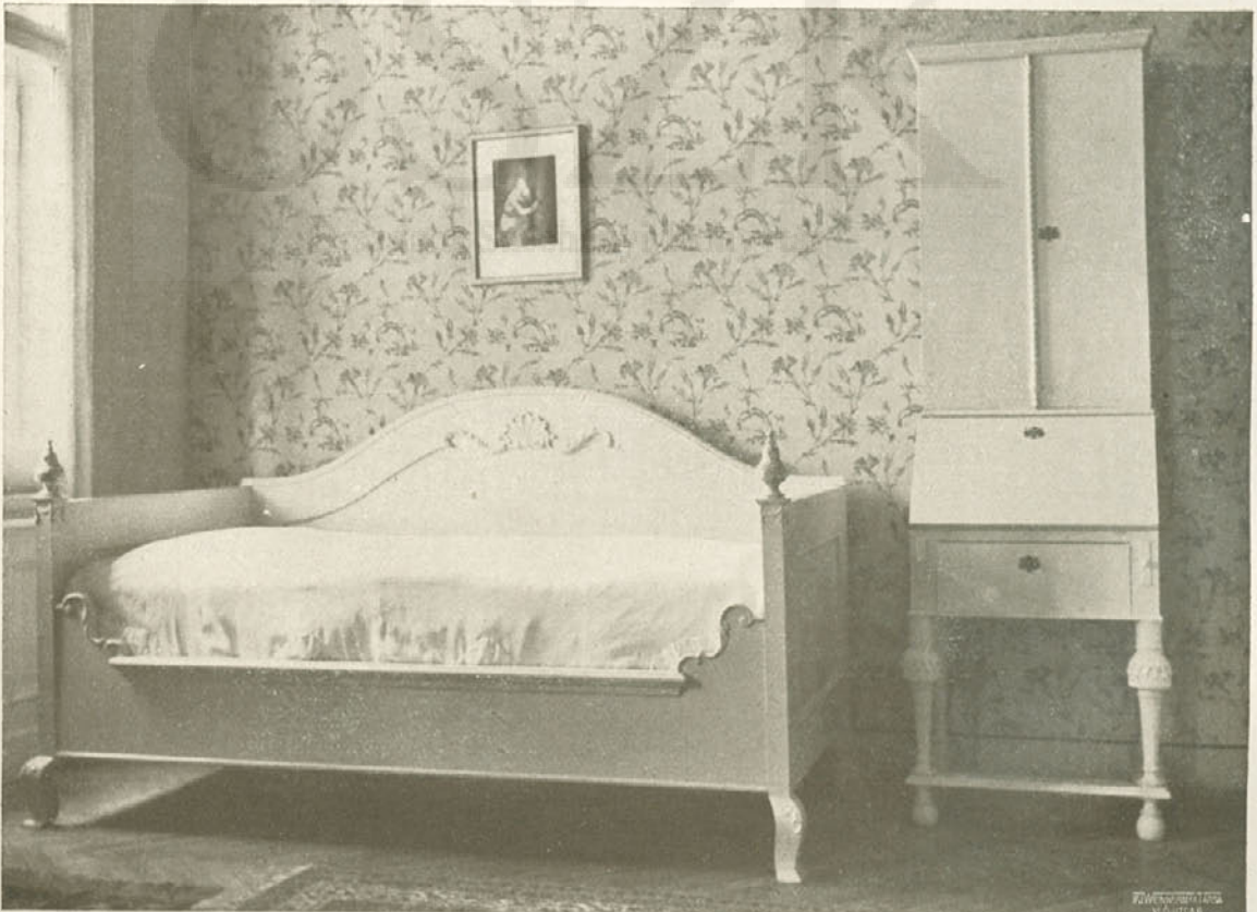
Gróf József: Hálószoba részlete. Leányszoba ágya és írószekrénye. Készültek Faragó és Gróf műhelyében. — Teil eines Schlafzimmers, Bett und Schreibkasten. — Chambres à coucher.