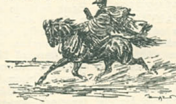
Haranghy Jenő: Ex-libris.