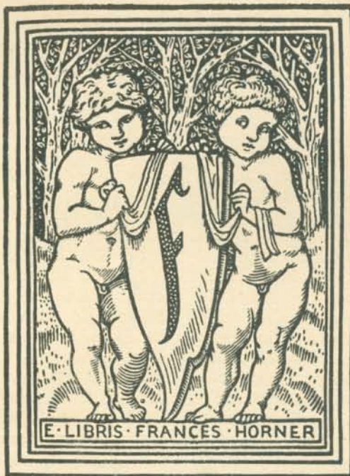
Burne Jones: Ex-libris. Az O. M. Iparművészeti Múzeum gyűjteményéből.

Erre a nevezett prelátus — saját szempontjából fe- lette hazafiatlan — nyilatkozatán kívül ismét egy osztrák példa sür- get. A bécsi ipar- művészeti iskolá- nak jeles tanára, Barwig Ferenc csodás szépségű betlehemet fara- gott a tulli temp- lom számára. Mindazt, amit az ideális fafaragás- ról összefoglal- tunk több száza- dos hanyatlás és siralmas vergődés után, ezen műal- kotásban tündéri