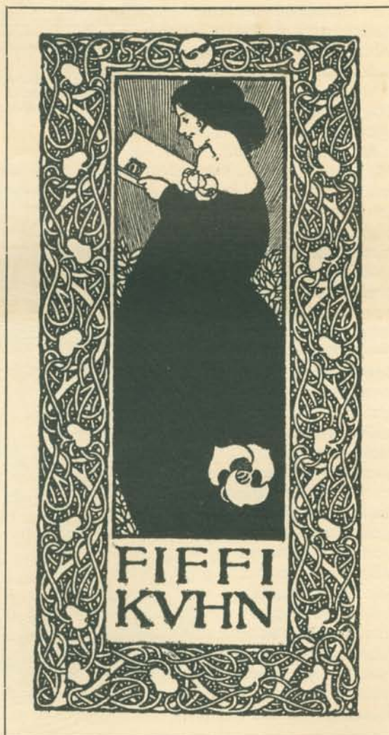
Simpson J.: Ex-libris. Az O. M. Iparművészeti Múzeum gyűjteményéből.