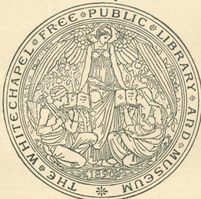
Walter Crane: Ex-libris. Az O. M. Iparművészeti Múzeum gyűj- teményéből.

klérusnak kezén kellene hordoznia e zseniális embert és csodás tehet- ségét kiaknázni az egyházi fafaragás számára. Szinte azt mondanám monopóliumot kel- lene reá szerez- nie. S íme! Míg a laikus közönség tolong Barwig bet- leheme körül, a bécsi klérus nem is mutatkozik. Hár- man valánk egy- háziak, akik a ki- állítás megnyitása óta hosszú időn át megtekintettük s mi hárman ma- gyarok valánk.