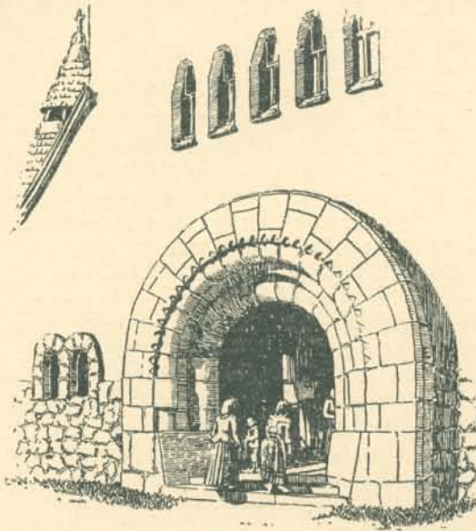
A zebegényi templom kapuja.