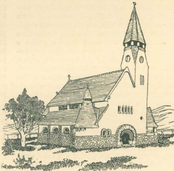
A zebegényi templom.

A zebegényi templomból a mult századi művészetnek két démonát füstölték ki: a naturalista-másolást és a morális művészet régi hagyományait megvető vászonfestési felfogást. Helyettük a stilizáló művészet és a freskófestés stiláris felfogása iktattak jogaikba. Mert a mult század falfestészetét szintén belegabajodott a vászonfestészet naturalista útvesztőjébe. Ami az utóbbinál jogosult, a természet jelenségeinek festői eszközökkel való megéreztetése, az a falfestészetnél főbenjáró hiba, mert megfelelkezik életetadó lényegeről, a nagyvonalú dekoratív hatásról. A monumentális falfestészet nagy helyiségek díszítő művészet. Nem tenyérsny vagy arasznyi felületek művészi kiképzéséről van szó, hanem egy nagy térnek egységes hatásáról, első pillanatra összefoglaló benyomásáról. A temp-