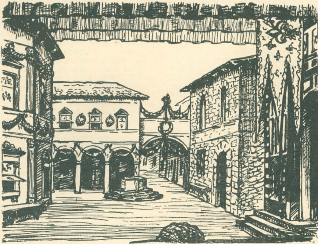
Gr. Zichy István: „Boccaccio“ II. felvonás.