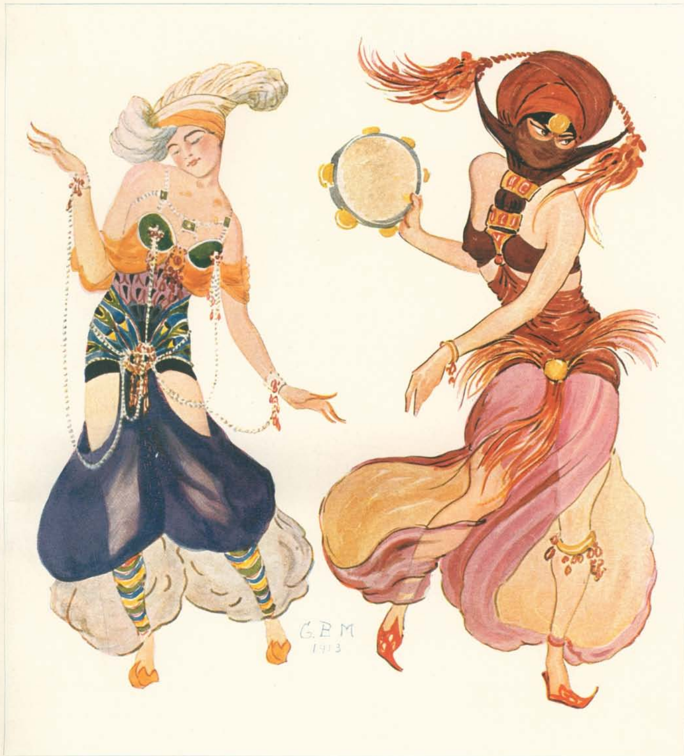
Gróf Bánffy Miklós: Jelmezvázlatok. „Oberon.”