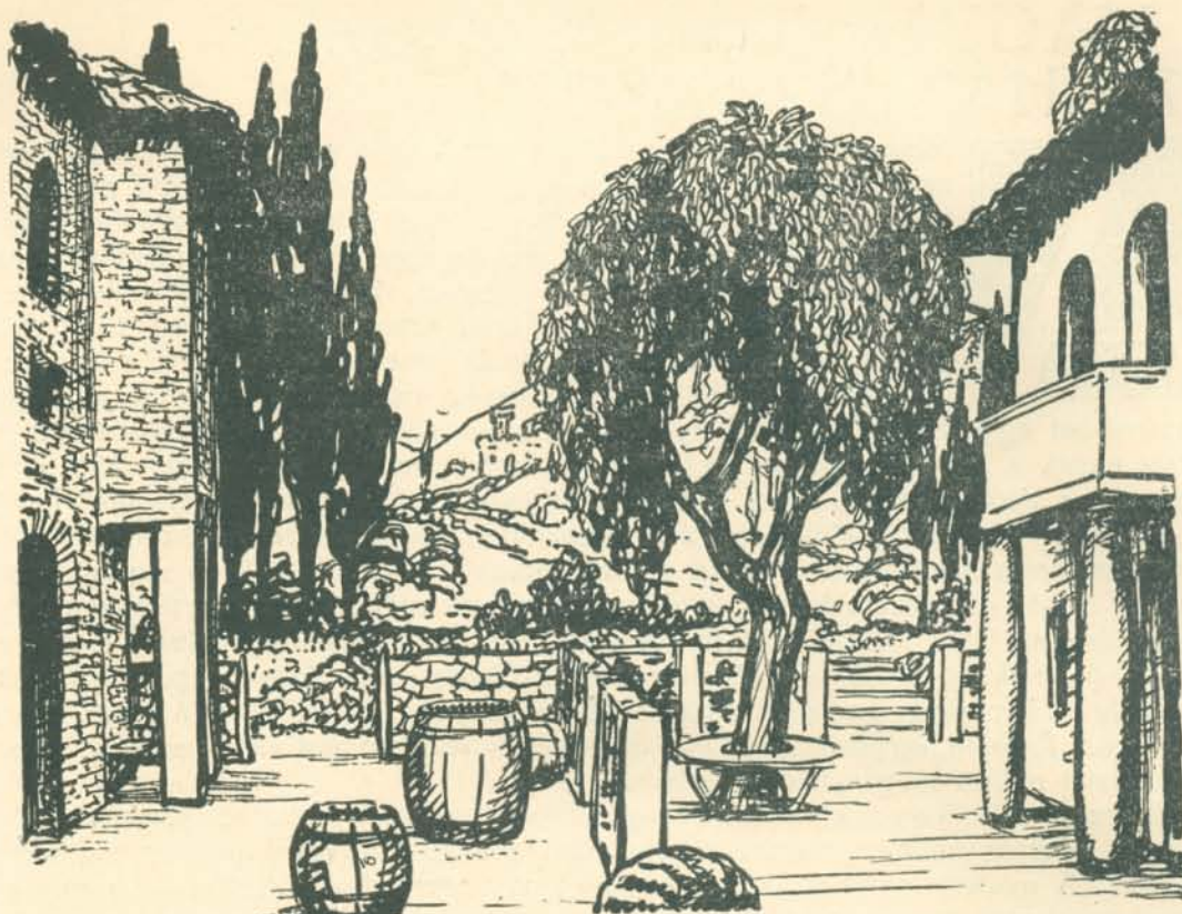
Gr. Zichy István: „Bocaccio”. I. felvonás.