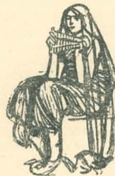
Dessins pour les musiciennes de „Salome“.