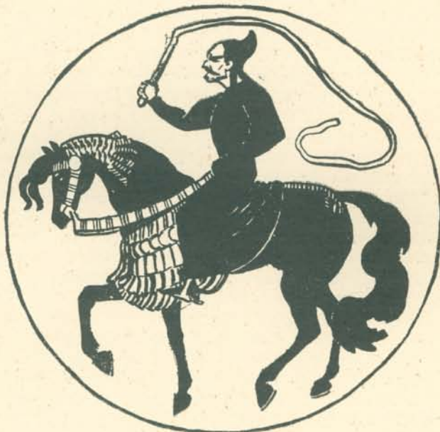
Gróf Bánffy Miklós rajza.