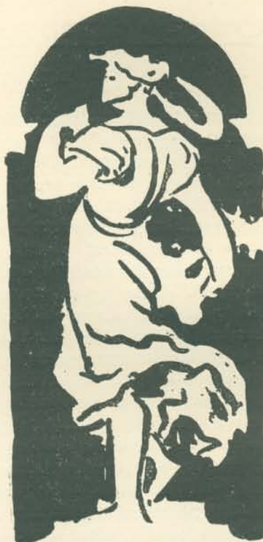
ESQUISSES AU SGRAFITO AU PIGNON DU PALAIS DES CHEMINS DE FER DE L'ÉTAT.

menő feltűnést is keltett), amikor Lenbach, a későbbi nagy portraitista, még kezdetét járta a maga művészetének. Történeti képeiben mind felfogás, mind előadás dolgában szembenállott mestereivel, Pílotyval és Kaulbachchal, akik később ugyan teljes elismeréssel hajoltak meg eredetisége és teljesen egyéni törekvése előtt, de eleinte sokat gáncsolták éppen ezen tulajdonságaiért. Különösen Píloty vetette szemére nyughatatlan kereső szellemét. Mesterének e szemrehányásaival szemben így védekezik naplójában: