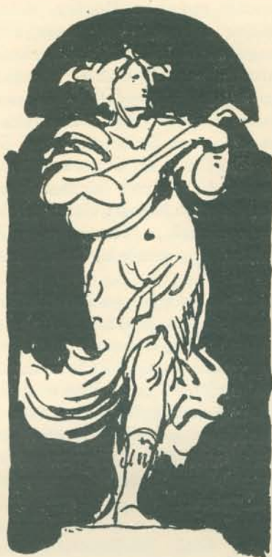
SGRAFITTO-VÁZLATOK AZ ÁLLAM- VASUTAK NYUGDÍJINTÉZETI PALOTÁJÁNAK HOMLOKZATÁRA.