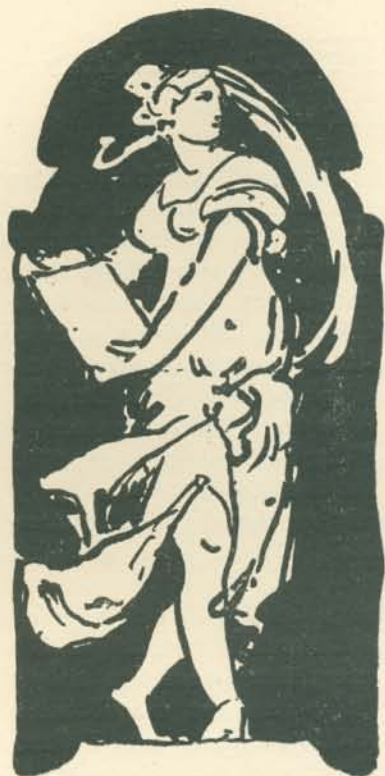
SGRAFITTO-VÁZLATOK AZ ÁLLAM- VASUTAK NYUGDÍJINTÉZETI PALOTÁJÁNAK HOMLOKZATÁRA.