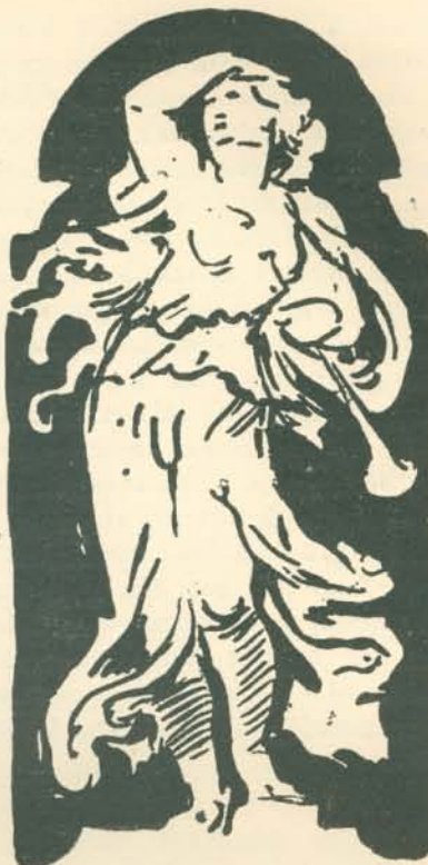
SGRAFITTO-VÁZLAT AZ ÁLLAM- VASUTAK NYUGDÍJINTÉZETI PALOTÁJÁNAK HOMLOKZATÁRA. ESQUISSE AU SGRAFITO AU PIGNON DU PALAIS DES CHEMINS DE FER DE L'ÉTAT.

Mert Székely Bertalan nemcsak mint alkotó művész óriás, hanem nagyjelentőségű mint a magyar művészet nevelőmestere is. Nem szólva arról, hogy Lotz Károly tehetsége az ő hatása alatt bontakozott ki és fordult teljes erővel a dekoratív művészet felé, nem szólva arról az irányjelző munkásságról, amelyet egy-egy műemlékünk létrejötte körül kifejtett (a Mátyás-templom restaurálásában és a Halász-bástyánál jobb keze volt Schuleknek), nem szólva Mészölyhöz, a tájképfestőhöz való tanító viszonyáról, a jelenlegi magyar művészetnek majd minden számottevő alakja