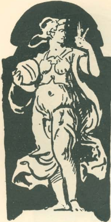
SGRAFITTO-VÁZLAT AZ ÁLLAM- VASUTAK NYUGDÍJINTÉZETI PALOTÁJÁNAK HOMLOKZATÁRA. ESQUISSE AU SGRAFITO AU PIGNON DU PALAIS DES CHEMINS DE FER DE L'ÉTAT.

az operaházi muzsák szemben Baudry párisi muzsáival, így a „Krisztus a keresztfán“ terve szemben az összes eddigi megábrázolásokkal, amelyeken a Megváltó és a két lator felfeszített alakjai között a formai és színbeli összefüggés megoldatlan maradt. Ez a jelentősége történeti festményeinek, amelyek se nem német, se nem francia, sem Delacroix vagy Delaroche, sem Piloty vagy Kaulbach és Cornélius hatása alatt nem állanak, hanem új ösvényt jelentenek az eddig ismert történeti festészethez képest: elmélyítvük felfogásban, merészek és eredetiek a formai megoldásban, a kolorisztikus erőben, s mindakettőnek szimbolikus gazdagságában.