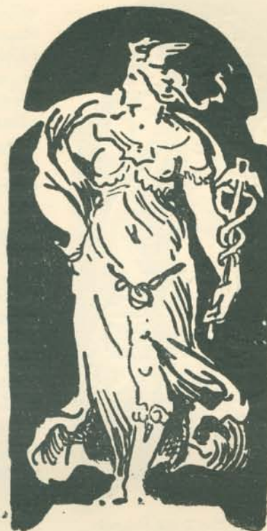
ESQUISSES AU SGRAFITO AU PIGNON DU PALAIS DES CHEMINS DE FER DE L'ÉTAT.

Abban a korszakában, amelyről azt vélték, s amelyről sokan még ma is állítják, hogy a müncheni befolyás alatt elméjét a történelemfestés foglalta le, lelkesedéssel foglalkozott a természet tanulmányozásával, festett és rajzolt ezernyi természeti tájat, népeletet, kutatta a freskófestés titkait, tanult architektúrát és ornamentikát, megpróbálkozott az „art appliqué“ terén, figyelte és rajzolta a madarak röptét, az állatok mozgását, szóval nyughatatlan elmével készült a jövőre áhított s tán sejtett nagy feladataira, amelyekben végül, mint a képzőművészetek polihisztorja, mint egyetemes tudású és képességű formaművész, az összes művészetek harmoniájának nagy megérzője, megértője s a gyakorlatban is megvalósítója bontakozott ki.