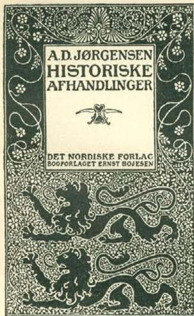
NORVÉG PÉLDA: A SZEDÉS ÉS KERETDÍSZ ELRENDEZÉSÉRE.

téved, mert másolni nem lehet, csak újat kigondolni, új célra, új csoportosításban. Sem Morríst, sem a régi mesterek megcsodált műveit nem lehet mintáknak venni. Azok csak arra jók, hogy felnyissák a szemet. Rajtok keresztül csak kutatni kell azt a szellemet, azokat a módszereket és elveket, amelyekkel a művészi munkát a nyomdászatban létrehozták. És ha azt megértettük és megértettük, akkor annak megfelelőleg kell dolgozni. Csodáltassuk meg az ifjakkal, amit a régiek csináltak, de fürkészteszük is ki, hogy mit hogyan csináltak, figyelmeztessük aztán a jelen anyagaira és technikáira, s azonközben ki fog fejlődni a képesség az újabb alkotásokra is. A tudomány és a művészet hagyományainak feltárása tehát csak addig a fókig hasznos, a meddig az alkalmas az egyének szaktevékenységét növelni. Akik előttünk éltek, azok hosszú és nagy küzdés árán szerzett tapasztalatokkal figyelmeztetnek