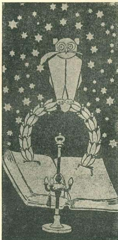
TÉVESFELFOGÁSÚ TERVEZET A NYOMDÁSZ-SZAKISKOLÁBÓL.