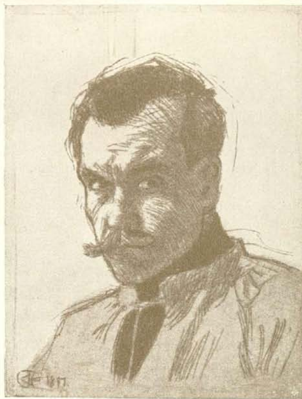
MEGVÁSÁROLT PÁLYAMŰ: HELBING FERENC RAJZA.