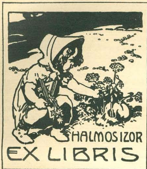
II. Díj: FÖLDES IMRE RAJZA.

vészi értékét semmi sem szállítja úgy alá, mint az, ha formájuk vagy díszítésük csak a gyakorlati célok rovására érvényesülhet, vagy ha a forma nem felel meg az anyag természetének. Ha következetesen ragaszkodunk ehhez a szabályhoz, mindig tisztában leszünk azzal, hogy a régi egyházi szerelvények közül melyeket nem szabad mintáknak elfogadni akkor sem, amidőn a modern egyházi művészet megteremtésére az egyházi körök átlagos izlésével és felfogásával számolva törekszünk.