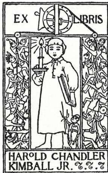
26. H. ELLWOOD. AMERIKA.