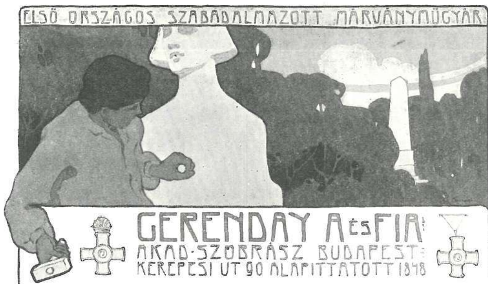
BARKÁSZ LAJOS RAJZA.