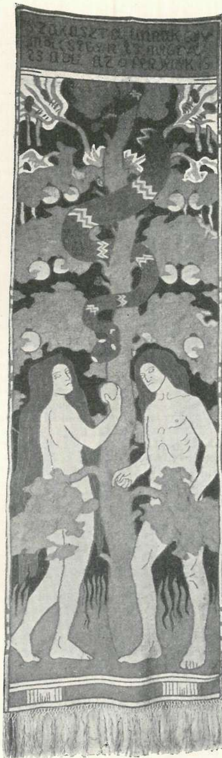
ÁDÁM ÉS ÉVA. SZÖVÖTT FALISZŐNYEG. KRIESCH ALADÁR RAJZA UTÁN KÉSZÍTETTE KOVÁLSZKY SAROLTA, NÉMET-ELEMÉR.

A st. louis-i kiállítás alkalmából ezzel szemben Deutscher Künstlerbund cím alatt szövetkeztek a német birodalom összes szecessziós és szabad művészeti