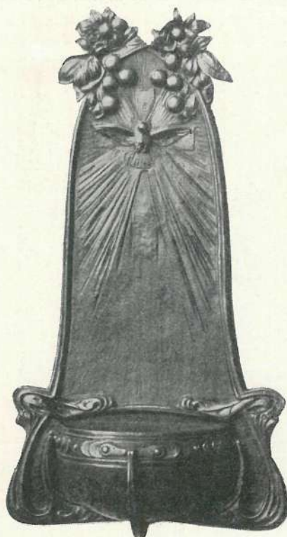
SZENTELT-VÍZTARTÓ, DÖMBÖRÍTOTT RÉZBŐL. DIJAZOTT PÁLYAMŰ.