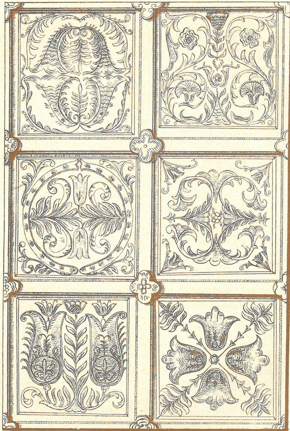
RÉSZLET A MEGYASZÓI REF. TEMPLOM FESTETT FAMENYEZETÉRŐL 1735-BŐL.