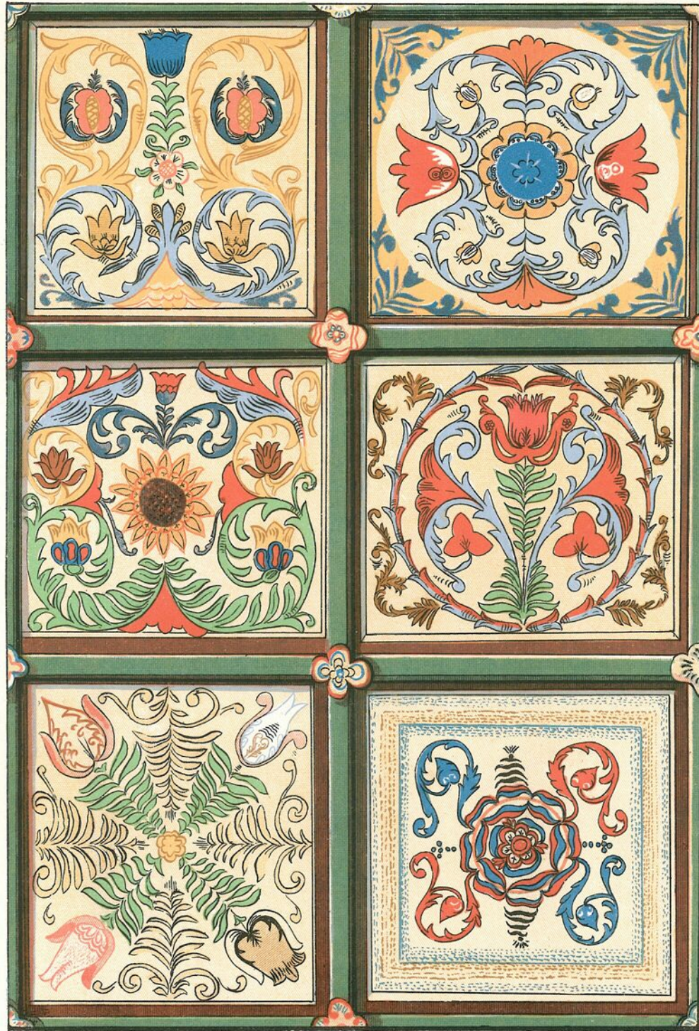
A MEGYASZÓI REF. TEMPLOM FAMENYEZETE.