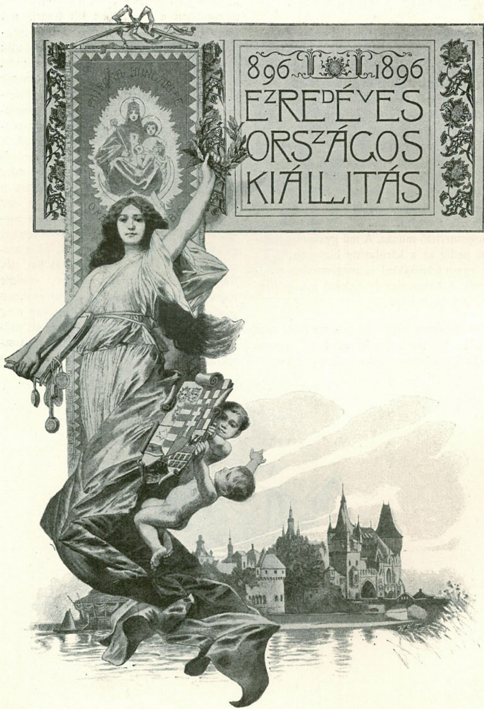
Vágó Pál rajza.