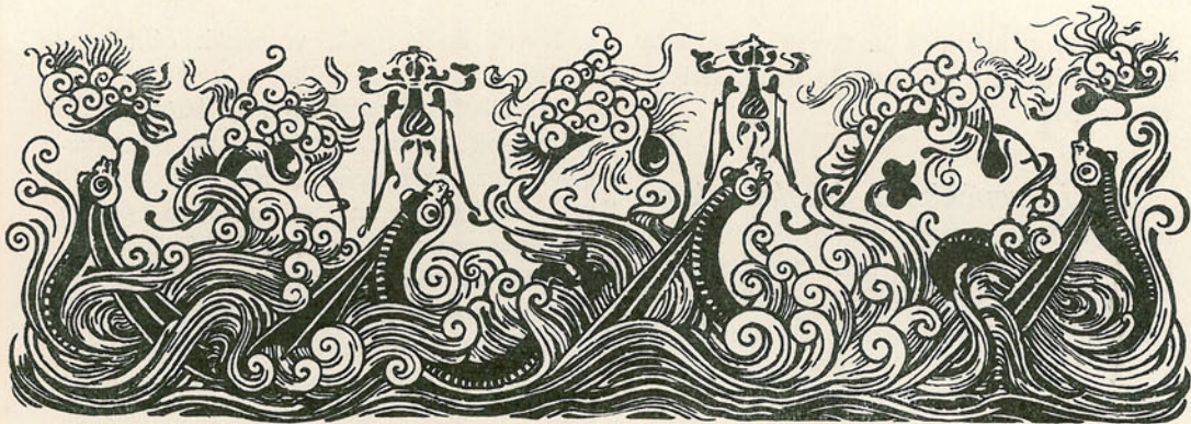
SZÉKELY ÁRPÁD RAJZA.