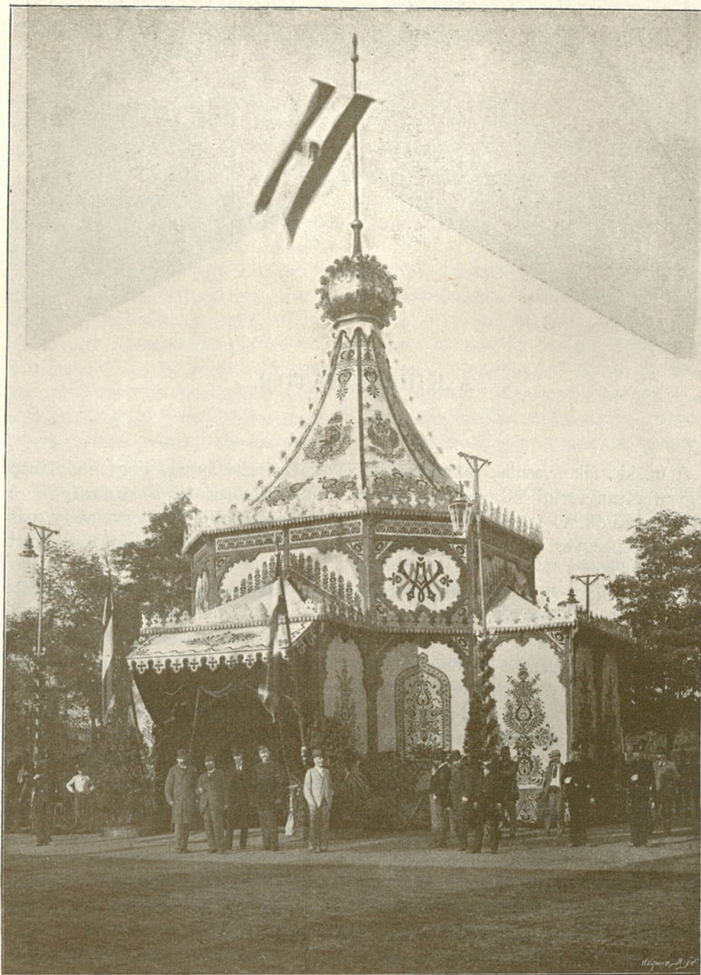
A MAGYAR ÁLLAMVASUTAK KIRÁLY-SÁTORA. Tervezte Várdai Szilárd.