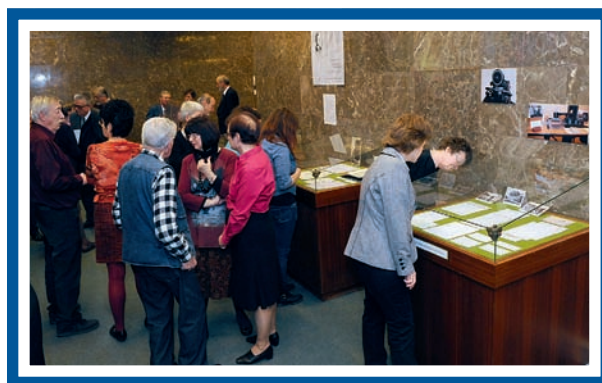
A kamarakiállítás megnyitója

ványai folytatták, eredményeit felhasználták és továbbfejlesztették munkatársai, akik azóta maguk is a szakma nemzetközi szinten elismert és köztiszteltetben álló képviselői lettek. Munkájának eredményei így ma is élnek: publikációit ma is olvassák, emlékét őrzi a magyar könyvtárosok, szakmai reformjai pedig beépültek a nemzeti könyvtár szolgáltatási rendszerébe. A novemberi tárlaton kiállított művek ezeket is jól példázták, a Könyvtártudományi szakkönyvtár olvasótermében pedig művei ma is azonnal elérhetőek, folyamatosan az olvasók rendelkezésére állnak.