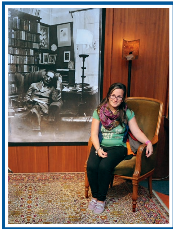
Fotózás Babits lámpájával a Múzeumok Éjszakáján

tett, rajzolt is – a lámpaernyő is az ő keze munkája, akárcsak az „Angyaloskönyv”-ként ismert kéziratos gyűjtemény itt is bemutatott borítója.