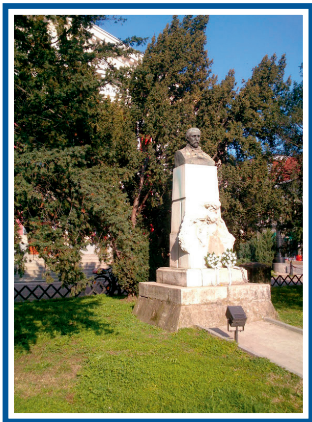
Szigligeti Ede szobra a nagyváradi színház előtt