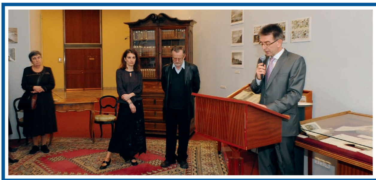
A kiállítás megnyitása