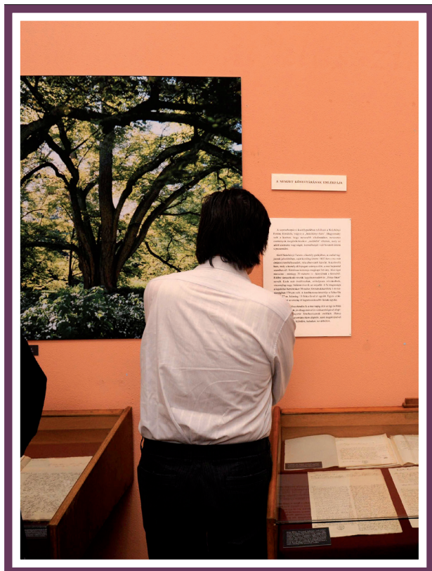
Az alapítóhoz írott levelek a könyvtár fája körül

Öt órakor kezdődött és az estébe nyúlt a díszteremben a Könyvtárlat sorozatunk újabb rendez-