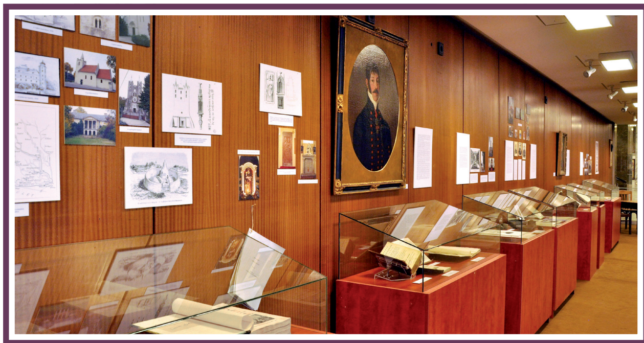
Részlet a kiállításból

szintű felkészültséggel járta be egymás után a magyar hitvilág, a magyarországi művészet és iparművészet, magyar művelődéstörténet, végső soron a magyar történelem fontos tájékait, hogy csaknem minden tárgyban, amihez hozzáfogott, maradandót alkosson. Az autodidakta módon elsajátított paleográfia, az oklevéltan, az archeológia és az összehasonlító stíluskritika jelentették legfőbb eszköztárát. Nagy ívű műveltsége még a 19. század elejének tudományosságában gyökerezett, ezért szempontjai és megközelítési módjai mindig globálisak volt. Ismerte, és művelte az országleírás összetett műfaját, melynek jegyében a tudós vándor nem csupán egy elemre, hanem a kiválasztott ország rész egészére koncentrált. Báró Mednyánszky Alajos „iskoláját” kijárva Ipolyi a Csallóközről készített festői leírást, amelyet a Vasárnapi Ujságban az egész ország figyelemmel kísérhetett. A régi országleírók szinte kikerülhetetlenül rögzítettek olyan jelenségeket is, amelyeket ma néprajzi megfigyeléseknek nevezhetnénk. A Mednyánszky Dénes nevelőjeként eltöltött néhány év Ipolyi esetében döntőnek bizonyult e tekintetben. A fiatal