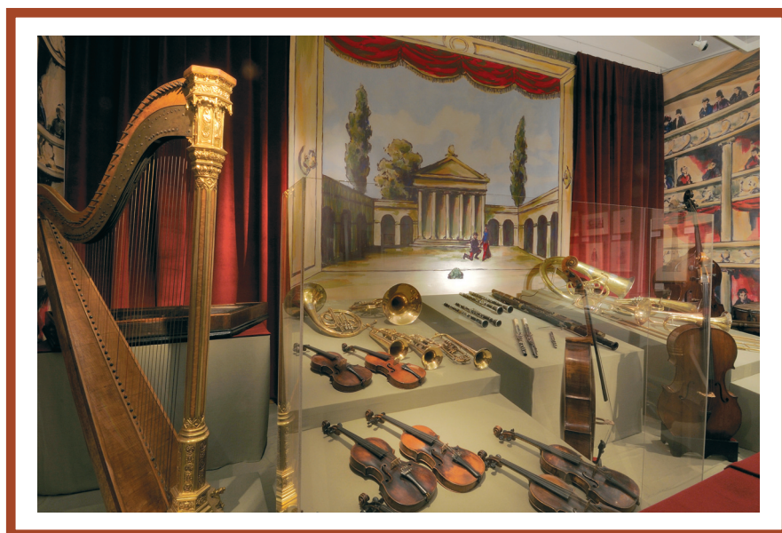
Alternatív javaslat a kinagyított színpadképhez

remben ismerkedhetünk meg, melynek felirata Opera és nép . Feltűnő, hogy mind a Sarolta (1862), mind pedig a Névtelen hősök (1880) vígoperai cselekvénye népi közegben játszódik, egyúttal azonban katonai mellékszálal is tartalmaz – ennyiben tehát a komikus történet végső soron összekapcsolódik az előző terem történelmi témáival. A két mű háttérét felrajzolva ugyanakkor mind az előzményekkel – Bartay András vagy Doppler Ferenc hasonló milióban játszó műveivel –, mind pedig a „könyvedebb”, elsősorban népszerű dallamok feldolgozására épülő társműfaj, a népszínmű néhány jellegzetes példájával is megismerkedhetünk.