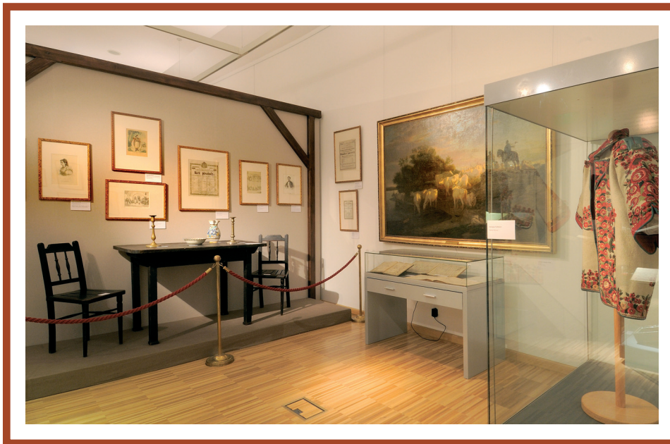
Az „Opera és a nép” terem részlete

A következő terembe egy kis átjárón keresztül vezet utunk, melynek középpontjában Stróbl Alajos Erkel-mellszobra áll, falait pedig a zeneszerző operáinak különféle előadásaihoz kapcsolódó színlapok másolatai borítják. Az Opera és történelem kapcsolatának szentelt