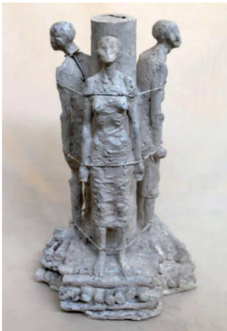
Ungvári utolsó alkotása

A művész utolsó, talán teljesen be sem fejezett munkája a háború áldozatainak állít emléket. A máglyahalált jelképező alkotáson az oszlophoz