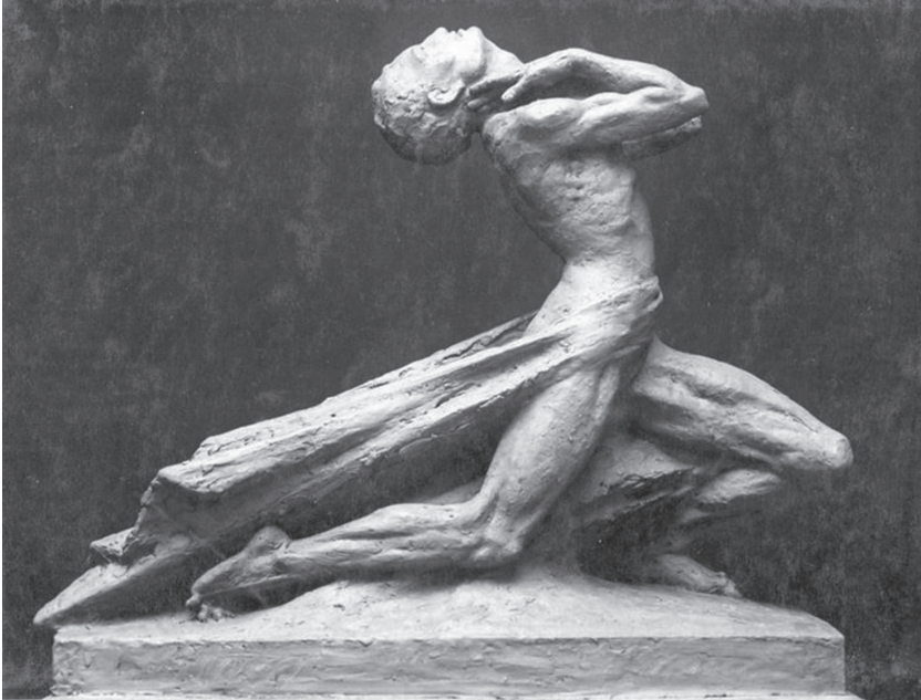
A Tékozló fiú

az 1926–31 között Rio de Janeiroban épült hatalmas Megváltó Krisztus szobor ihlette. Az újságokból Ungvári erről tudomást szerezhette. De ha nem így volt, akkor a föld két különböző pontján a művészi szabadság szárnyalásának nem mindennapi, véletlenszerű találkozásával állunk szemben.